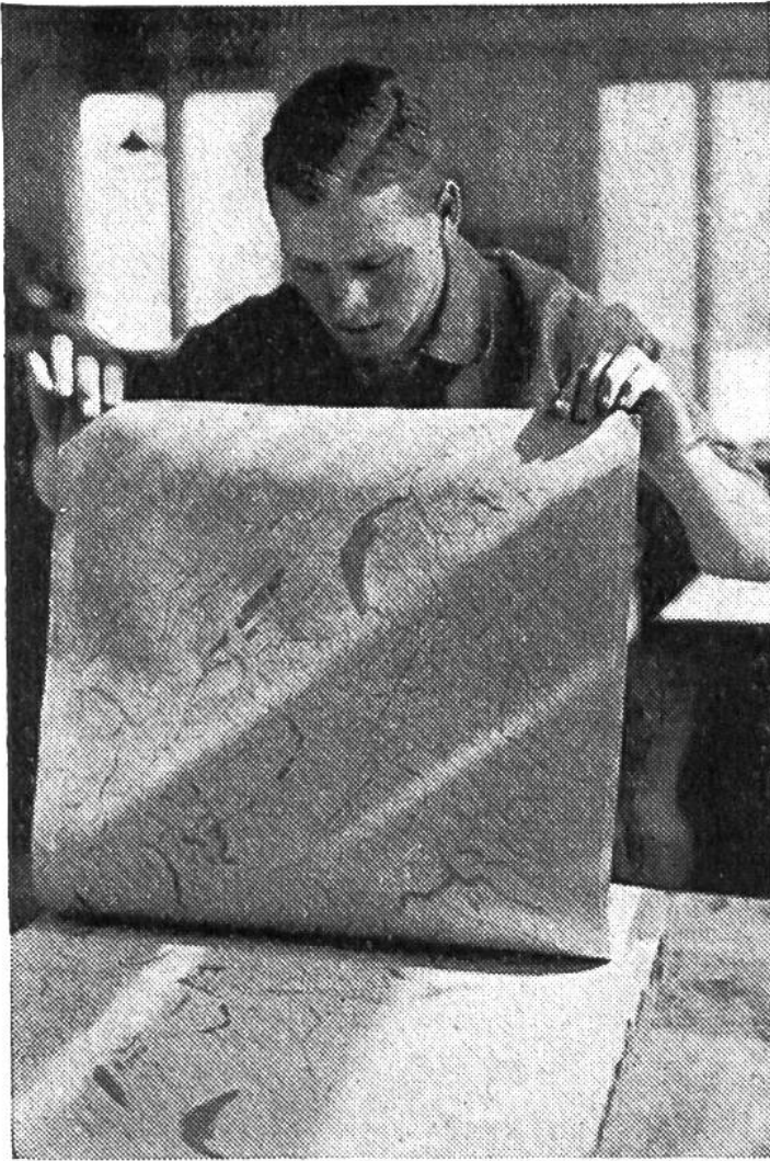
Der Umdrucker erstellt einen Umdruck auf die Druckplatte.

den mit spitzen Stahlnadeln eingeritzt; man nennt dies gravieren oder stechen. Die Farbtöne, aus denen das Relief, z. B. die Darstellung der Berge auf den Schulwandkarten, besteht, werden mit fetter Lithographiekreide aufgetragen und die Flächen, welche die politische Einteilung (Kantone oder Staaten) kennzeichnen, mit dem Pinsel aufgemalt.