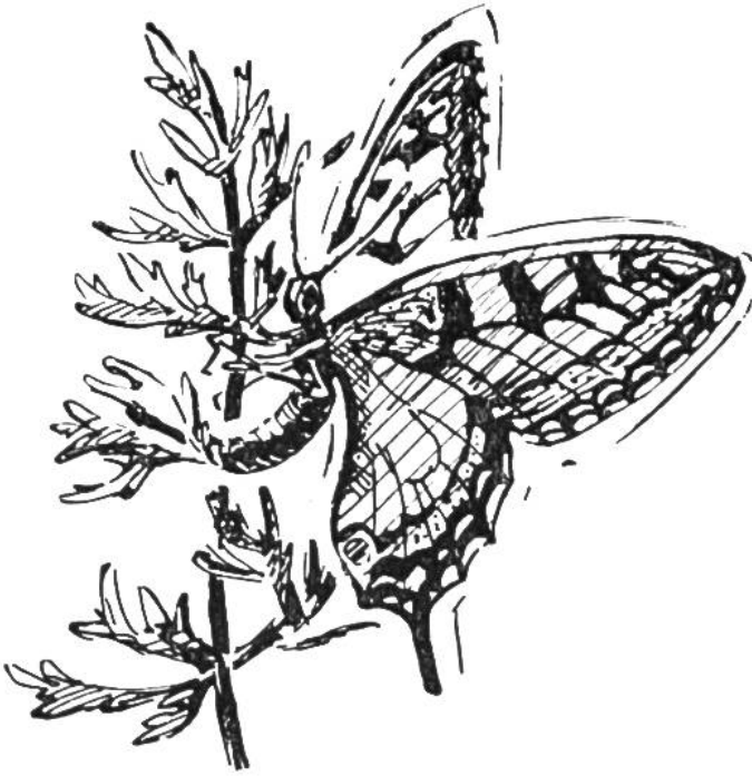
Schwabenschwanz, ein Ei an eine Möhre heftend.

nur scheint bei ihm der Zug dichter aufgeschlossen, so dass es manchmal aussieht wie loses Schneegestöber mitten im Sommer. Unser prächtiger Admiral gehört ebenfalls zu den „Wandernern“, aber man hat noch keine geschlossenen Züge beobachtet. Wäre es bei Nacht nicht so dunkel, so könnten wir noch eine ganze Anzahl feststellen, vor allem die Schwär-