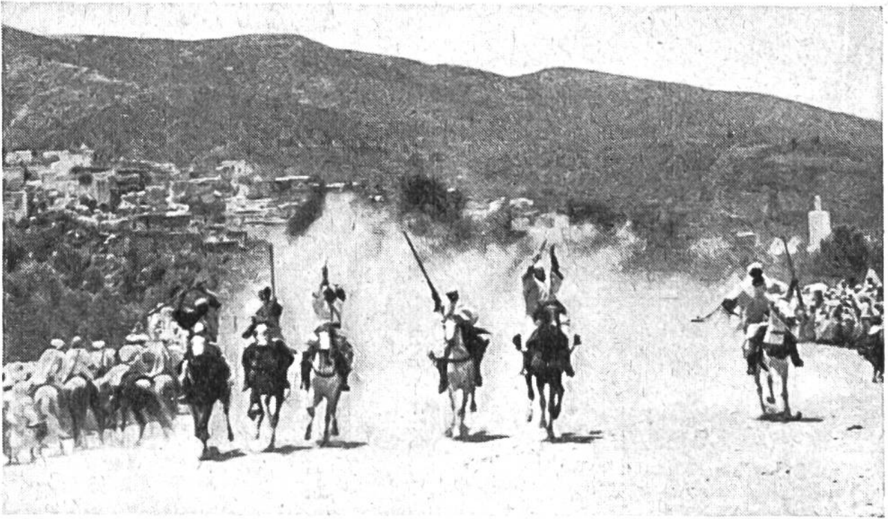
Die Fantasia ist in vollem Gange; eben sprengt wieder eine Reihe der zahlreichen Reiter im Galopp über den in der grellsten Sonne liegenden Platz.

halten. Aus dem ganzen Lande erscheinen die Söhne der verschiedenen Stämme mit ihren besten Pferden. Eine gewaltige Zeltstadt entsteht am Atlashang, und mit kaum zu zügelnder Ungeduld warten die stolzen Reiter auf den Beginn des Festes. Grosse Zuschauermengen, lauter Mohammedaner, haben sich versammelt, und die Wasserträger mit ihren tropfenden Schläuchen aus langhaarigen Ziegenfellen machen gute Geschäfte, indem sie die kostbare Flüssigkeit schalenweise an die vielen Durstigen ausschenken.