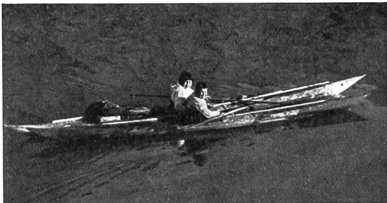
Zwei Eskimo-Kajaks, die leicht und schnell übers Wasser dahinzufitzen vermögen.

mit Fernrohren versehen am Strand, um dies Ereignis feststellen und weitermelden zu können. – Frauen und Kinder dürfen späterhin das so seltene Wunderschiff in Augenschein nehmen, bevor es wieder für ein Jahr hinter dem Horizont verschwindet und für die Eskimos in der völligen Abgeschlossenheit von den bewohnten Erdteilen nur mehr Wasser, Eis und Schnee mit dem scheuen Leben von Tieren und Vögeln – und ein paar abgeladene Fässer und Kisten zurückbleiben.