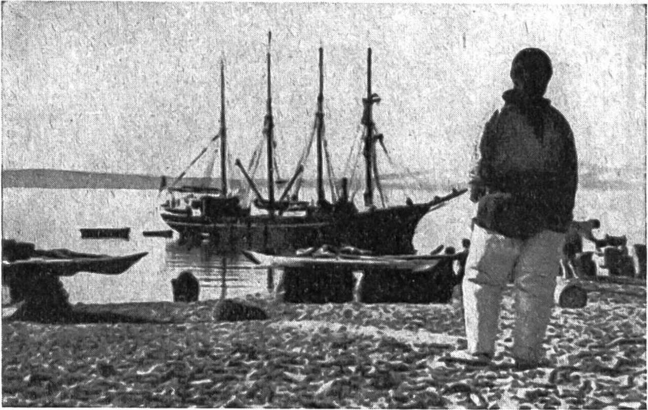
Die für die Eskimos wichtigen Lebensgüter werden ausgeladen.

sen einer der wildesten Schneestürme der dunklen Polarnacht tobt. In diesem einzigen Raum sitzen sie entblößten Oberkörpers beim Tranlicht und schmausen nach Herzenslust. Uns würde es wohl weniger munden; denn ihre Vorliebe für alle Arten rohen Fleisches, gefroren oder halbgefroren, entspricht nicht unseren Sitten. Auch erscheint es uns nicht gerade appetitlich, dass sie sich beim Essen der blossen Hände und eines eigenartigen Messers bedienen, mit dem sie die Bissen des mit den Zähnen gehaltenen Fleisches knapp vor den Lippen abschneiden. Die Eskimos besitzen, in primitiver Weise natürlich, einen ausgesprochenen Sinn für Musik, der sie befähigt, als eigene Komponisten und Dichter aufzutreten und sich auf einer Art kleiner Trommel geschickt zu begleiten.