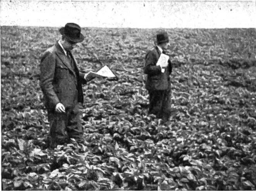
Feldbesichtiger bewerten den Saatkartoffelbestand einer landwirtschaftlichen Schule.

eintrat. Zeitlebens war er auch ein eifriger Förderer des noch wenig bekannten Kartoffelbaus. Als später die Schweiz wiederholt von Missernte und Teuerung heimgesucht wurde, wies die Obrigkeit jeweils mit Nachdruck auf die Nützlichkeit der Kartoffel hin. In einem Mandat vom 22. Februar 1772 forderten „Bürgermeister und Rath der Stadt Zürich“ das Landvolk auf, es möchte „auf den sonst ungenützten Plätzen mehr Erdäpfel pflanzen, als bishero geschehen, da diese eine nicht nur von den Zufällen der Witterung gesicherte und ergiebige Feldfrucht ist, sondern auch eine, sowie überhaupt, also fürnehmlich dem mit strengen Arbeiten beschäftigten Landmann sehr gesunde Nahrung sind.“ Diese Mandate wurden am Sonntag von den Kanzeln verlesen; sie bedeuten für uns Dokumente der Propaganda im Kampf gegen den Hunger aus einer längst vergangenen Zeit.