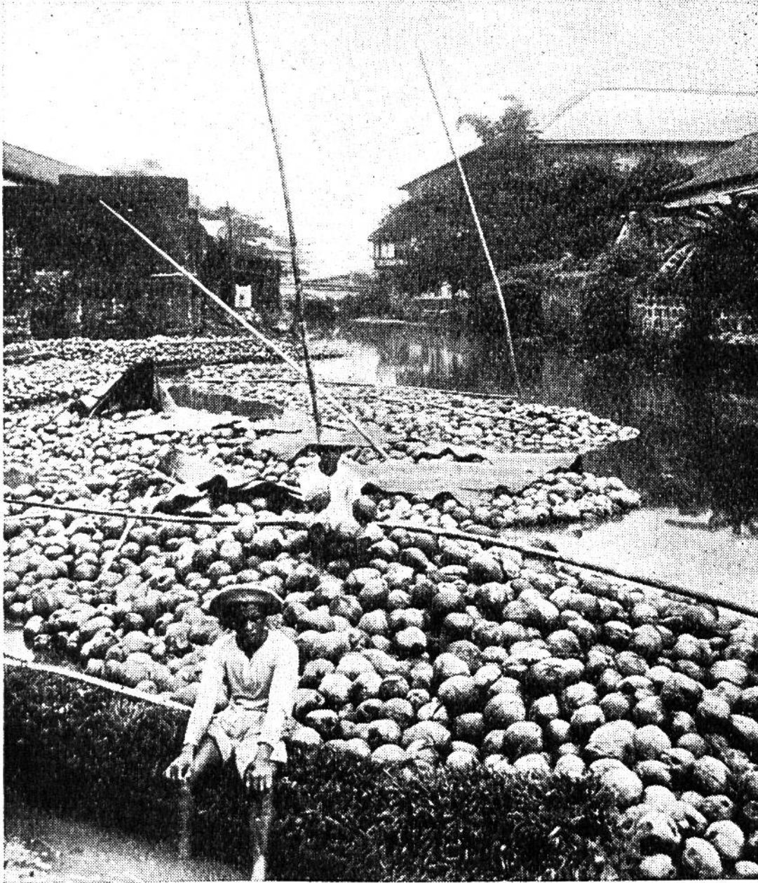
Riesenflösse aus Kokosnüssen fahren auf dem Wasserweg nach Manila, der Hauptstadt der Philippinen.

(Coir), die zu Schnüren, Seilen, Schiffstauen, Teppichen, Bürsten, Maschinentreibriemen usw. verarbeitet wird. Für die Fasergewinnung müssen die Nüsse unreif sein. Fasern und Kopra lassen sich also nicht von der gleichen Frucht gewinnen. Dagegen können die entfaserten unreifen Nüsse noch als Trinknüsse verkauft werden.