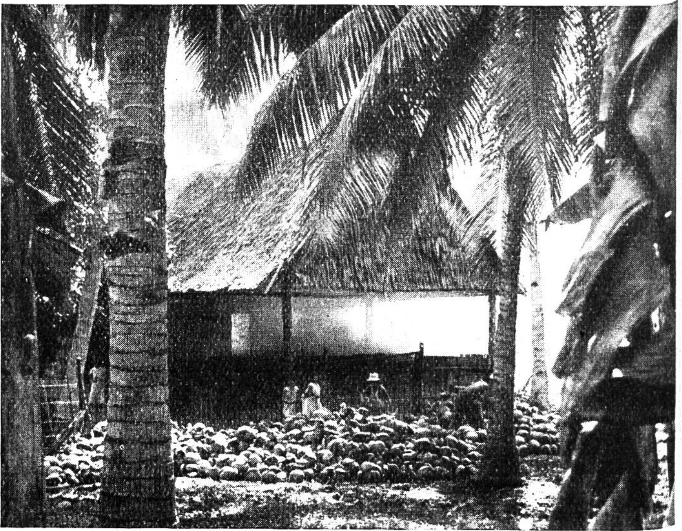
Kopragewinnung aus Kokosnüssen.

schmeckende Kokosmilch. Die bei uns angebotenen Kokosnüsse sind gewöhnlich schon von der sie umhüllenden, in einer lederigen Haut steckenden Faserschicht befreit. Die vollständige, etwa kopfgrosse Steinfrucht hat eine dreikantig-rundliche Form.