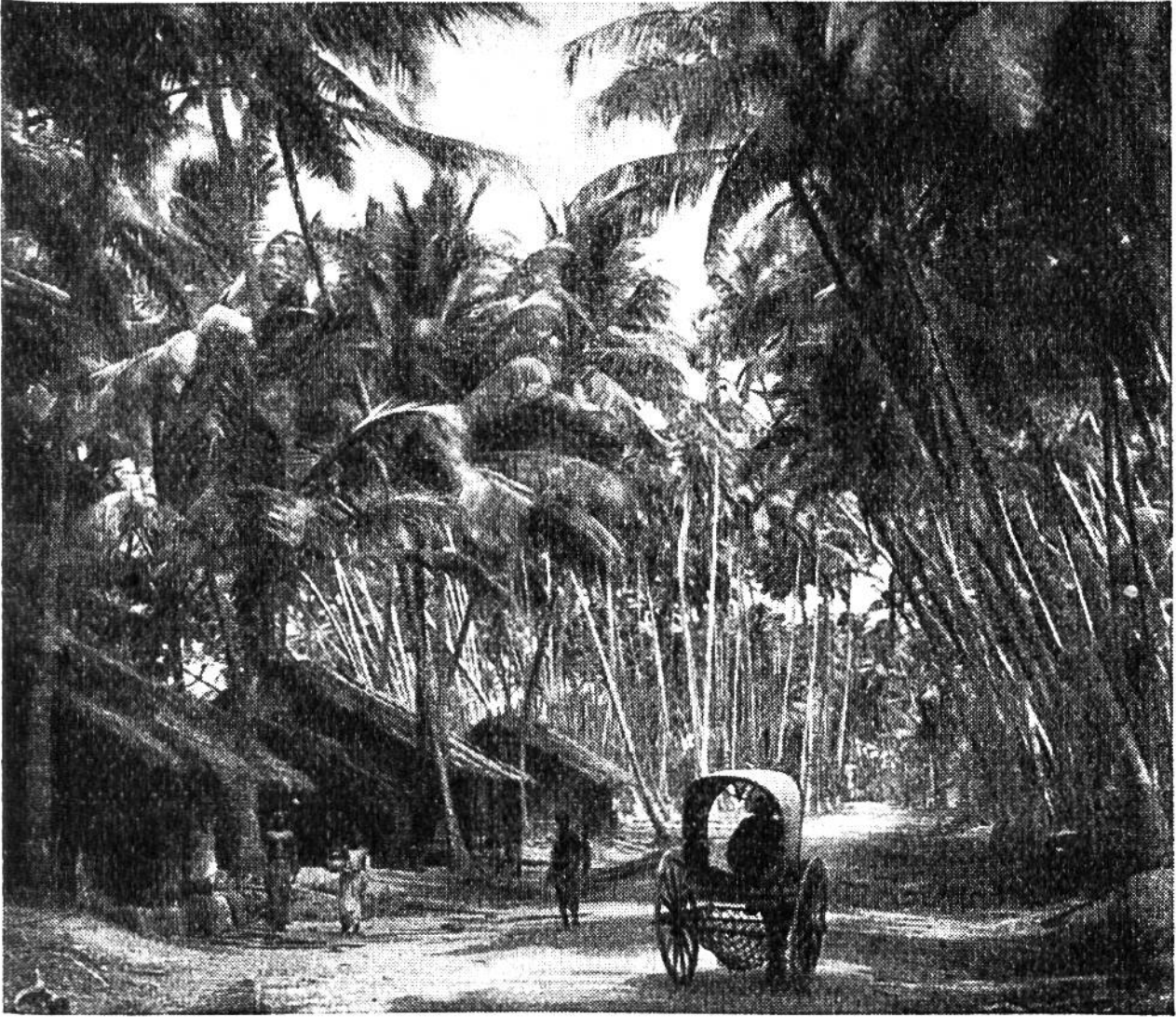
Kokospalmenhain auf Java.