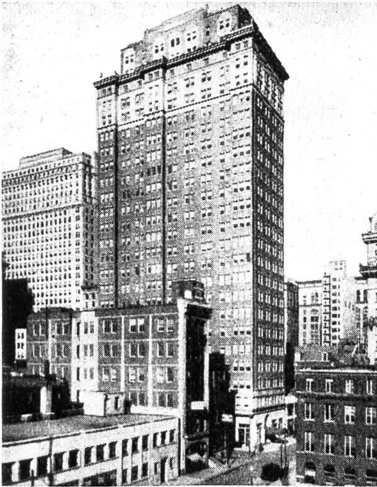
Vierundzwanzig Stockwerke neben einem zweistöckigen Gebäude – ein für Philadelphia typisches Gemisch.

keine Seltenheit mehr. Dreissigstöckige Hotels, Warenhäuser und Verwaltungsgebäude überragen als eigene Stadt das Häusermeer. Verschiedene Dimensionen hat der heutige Verkehr zusammenzuzwingen: hier die Untergrundbahn, die Strassenbahn, der Autobus, da der Fahrstuhl, der in Minutenbruchteilen die höchsten Stockwerke erreicht. Während drunten in den eng erscheinenden Strassen Lärm und Hast vorherrschen, umgibt die Hotelzimmer, Verkaufsabteilungen und Büros hoch oben dieselbe Ruhe hinter Glas und Beton, wie sie weit draussen in den Einfamilienhäuschen genossen wird.