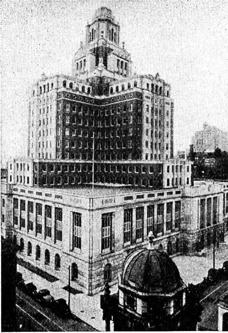
Terrassierung und Gliederung des Zollhauses von Philadelphia ermöglichen das Einfallen des Lichts in möglichst viele Arbeitsräume und auf die Strasse.

de? Den Stadtplan sehen wir uns an und stellen fest, dass er wie ein Schachbrett angelegt ist. Hunderte von Strassen kreuzen sich in rechtem Winkel; und jede Strasse ist, besonders in den Aussenquartieren, von niedrigen Einfamilienhäusern besetzt, so dass eine Fliegeraufnahme vierhunderttausend winzige, aneinandergeschlossene oder leicht von einander abgerückte Punkte in wunderbarer Ordnung aufweist. Diesen Stadtplan hat, allerdings in kleineren Ausmassen, schon vor mehr als 200 Jahren ein Mann entworfen, dem wir uns nun kurz zuwenden.