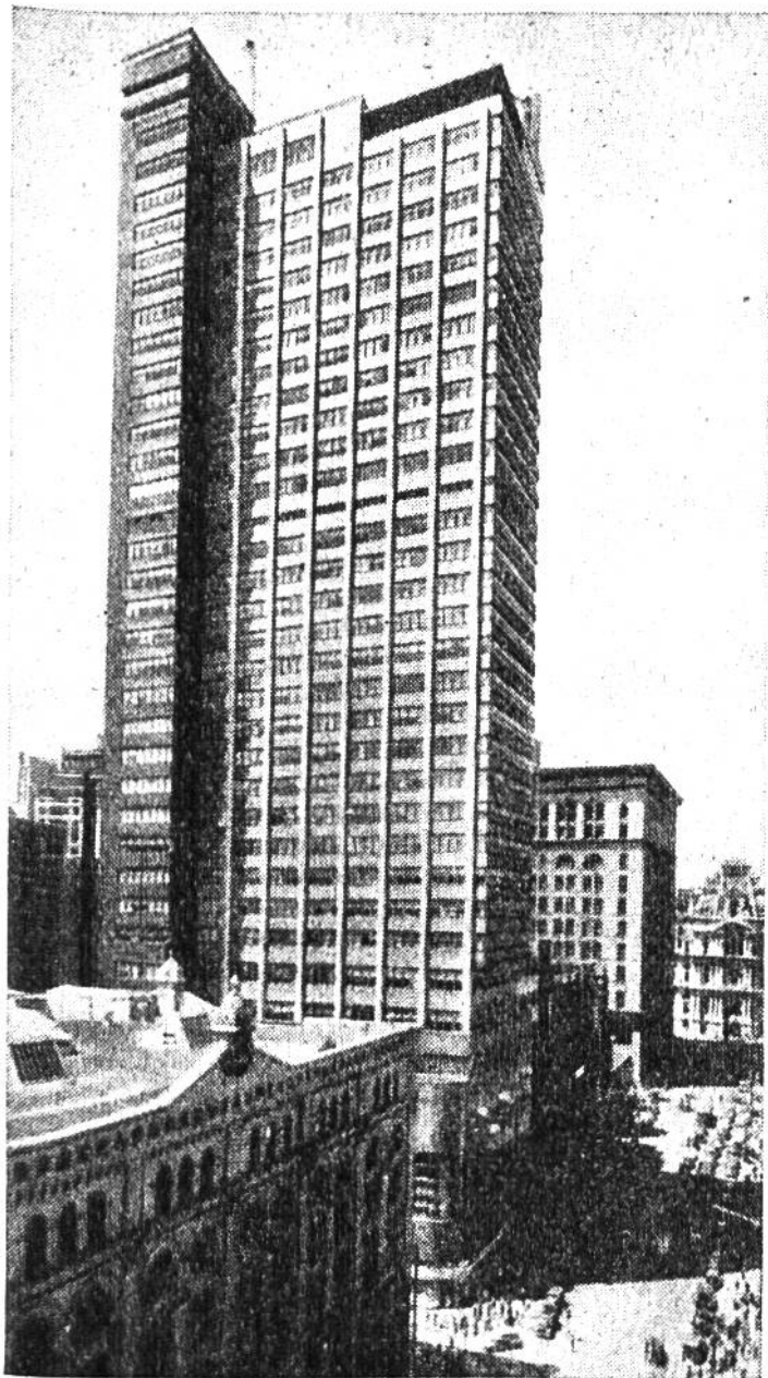
Die „Sparkasse“ von Philadelphia braucht nicht so sehr Schalterhallen als vielmehr eine Unzahl Büroräume.

eines Jahrhunderts zur angesehenen Stadt auswachsen sollte. Im gleichen freiheitlichen Geist versammelte sich hier 1774 der nordamerikanische Kongress, um am Nationaltag des 4. Juli 1776 die Unabhängigkeit von 13 nordamerikanischen Staaten zu verkünden. In Philadelphia wurde kurz darauf auch die Verfassung dieser ursprünglich 13 Vereinigten Staaten von Amerika entworfen, nachdem dort der treffliche Benjamin Franklin als Kongressmitglied gewirkt und George Washington, in eben dieser Stadt zum Oberbefehlshaber der