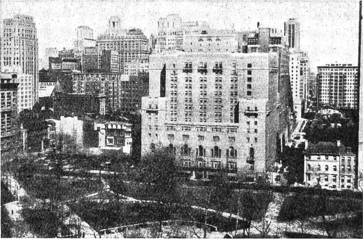
Als Oase im dicht gedrängten, modernen Geschäftsviertel liegt der alte Ritterhouse-Platz.

Sternwarte, Wasserversorgungswerke und Gemäldegalerien befinden, während sich ein zoologischer Garten dem grünen Areal anschliesst. Doch auf dem Delaware-Fluss, der nach 50 Kilometern schon die Bay und den Atlantischen Ozean erreicht, herrscht keineswegs die zu erwartende Stille: da laufen im modernen und gross angelegten Binnenhafen jährlich 12 000 Frachtschiffe durch die über 11 m tiefe Fahrrinne ein, bringen Zucker, Chemikalien, Wolle, Baumwolle und nehmen vor allem Kohle, Erdöl und Tabak mit sich. Und auch hinter den Schiffswerften wird in riesigen Fabriken gearbeitet, an Eisen und Stahl, im Lokomotivbau, in chemischer Industrie, im Textilgewerbe, im Verlagswesen. Wir aber auf dem europäischen Festland vernehmen durch den Äther aus jener werkenden, praktischen, nüchternen Stadt als einzigen und wunderschönen Gruss die Konzerte des berühmten Philadelphia-Orchesters mit den ausgesuchtesten Streichern der Welt!