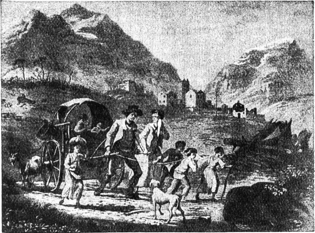
Die verarmten Familien retteten ihr blosses Leben.

Unter Alois Reding schlugen sie gegen den Franzosen Schauenburg los. Nach heldenhaftem Kampf mussten sich die Schwyzer den allerdings milden Bedingungen unterwerfen; in Nidwalden jedoch flammte der Widerstand von neuem auf und führte zum Schreckenstag vom 9. September 1798. Schwer wurde die sich hartnäckig wehrende Talschaft für ihr freiheitliches Unterfangen bestraft: an die 400 Menschen, darunter über 100 Frauen und Kinder, fanden den Tod; ihre Heimstätten wurden niedergebrannt, ihre Felder verwüstet, ihr Gut geraubt. Obdachlos irrten verwaiste Kinder umher und suchten Unterkunft, Hilfe und Trost. Derjenige aber, der diesen unglücklichen und unschuldigen Opfern wütender Rachelust in Stans ein Heim bot, der ihnen bei eigener Armut ein Vater, Lehrer und dienender Knecht wurde, war kein anderer als der noch heute verehrte Vorkämpfer der Menschlichkeit und der Namengeber unseres Kalenders: Johann Heinrich Pestalozzi.