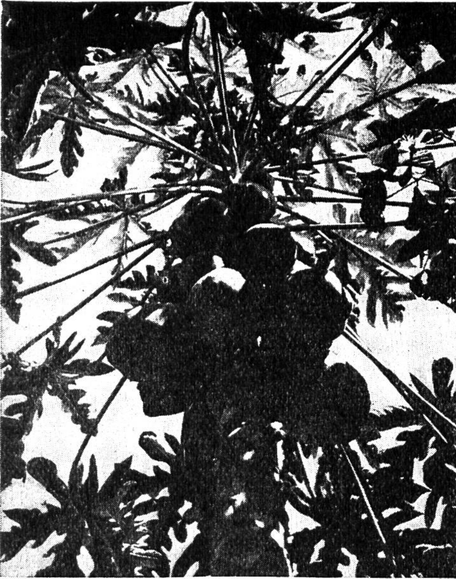
Papaya ist die einzige Tropenfrucht, die nicht transportiert werden kann.

Bis zu jenem Zeitpunkt, der erst etwa ein halbes Jahrhundert zurückliegt, war die gewaltige Insel mit ihren bis über 4000 m hohen Bergen und tropischen Urwäldern sogar von den das Ostchinesische Meer umwohnenden Völkern gemieden worden, und die im Jahre 1634 einsetzende Kolonisationsbestrebung der Holländer, Spanier und Japaner blieb ohne dauernden Erfolg. Heute umfasst die Bevölkerung vor allem Ansiedler aus dem stark überbevölkerten China und Angehörige der malaiisch-polynesischen Gruppe; in der Ebene der Westküste haben die ursprünglich ansässigen Bewohner die chinesische Sprache angenommen, auch auf den 2000 m hohen Vorgebirgen leben sie schon zivilisiert, während sie im Hochgebirge völlig ihren altüberkommenen Bräuchen der heidnischen Fetischverehrung huldigen.