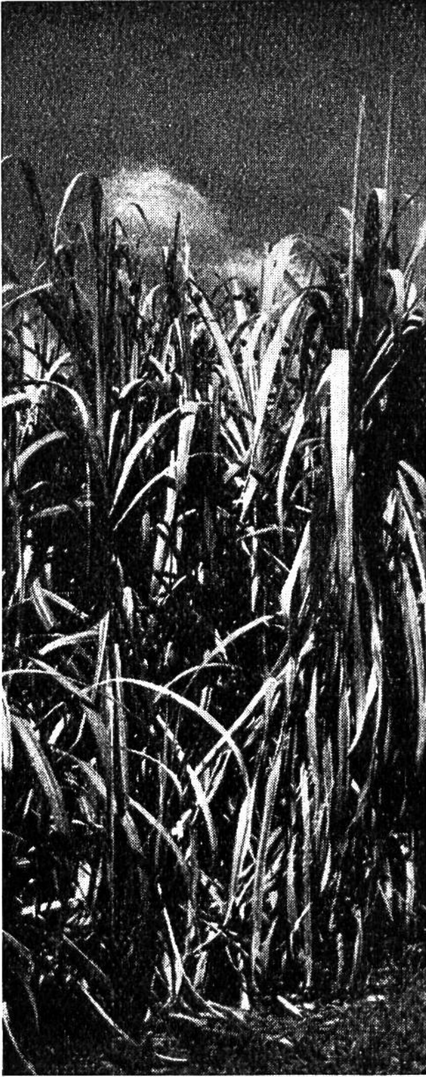
Zuckerrohr wächst in den Ebenen West-Formosas.

In ähnlicher Stufung ändert sich die Struktur des Landes: über den mit Kulturpflanzen bebauten Niederungen erhebt sich der Urwald, um in die höher gelegenen Steilhänge aus Schiefer und kristallinen Kalksteinen auszufließen. Das Gebiet ist vulkanisch, durchsetzt von Schwefelquellen und gelegentlich von kurzen Erdbeben erschüttert. Da die Küstenstreifen nicht breit und an der Südspitze sogar von Korallen und Tuff besetzt sind, erweisen sich nur zwei Flüsse als schiffbar. Dennoch hat das Land etwa fünfmal soviel Niederschlag wie die Schweiz, was zur Folge hat, dass sich die Bevölkerung mit Bodenkulturen beschäftigt, die dem feuchtheissen Klima entsprechen. Nicht so sehr die Vorkommnisse an Kohle und Erdöl werden ausgebeutet als vielmehr die Erträge der Wälder, wo Palmen, Lorbeerbäume und Kampferbäume gedeihen. Nutzhölzer, Erdnüsse und