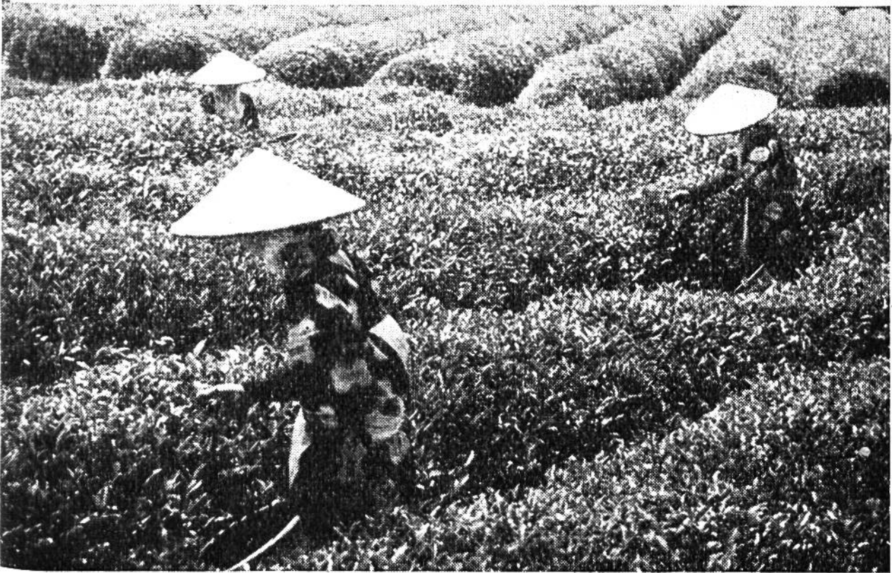
Bei der Tee-Ernte dürfen von geübter Hand nur die feinsten äussersten Blättchen gepflückt werden.

und andere Fledermäuse, fliegende Eichhörnchen, Schuppentiere und eine bestimmte Affenart gibt, sehr modern eingerichtete Zuckerraffinerien, Spritdestillieren und Mühlen aufweist. Nur der an jeder Küste selbstverständliche Fischfang und die fast ausschliesslich betriebene Schweinezucht von annähernd 2 Millionen Schweinen spielt neben der Verwertung der Pflanzen noch eine gewisse Rolle. Während der gewonnene Reis vor allem zur Ernährung der Inselbevölkerung dient, hat seit Jahrzehnten ein reger Aussenhandel in erster Linie mit Japan eingesetzt, wobei Tee, Zucker, Kampfer und Kampferöl ausgeführt werden.