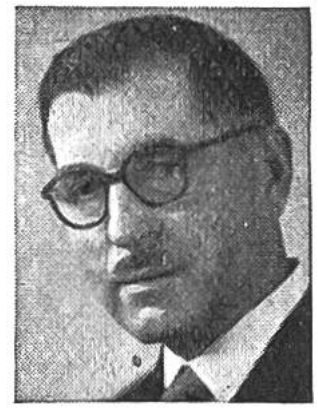
Dr. Karl Kobelt von Marbach (St.G.) * 1891 seit 1941 i. Amte Militärdepartem.