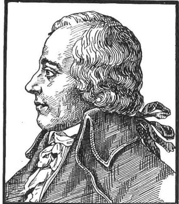
Pierre Simon Laplace,

(200. Geburtstag am 17. Mai) englischer Arzt, Begründer der Pockenschutzimpfung, * 17. Mai 1749 in Berkeley, † 26. Januar 1823 daselbst, war seit 1772 Wundarzt. Eine Bäuerin machte ihn darauf aufmerksam, dass Melker, die ungefährliche Kuhpocken gehabt hatten, gegen Menschenpocken (Blattern) unempfindlich seien. Diese Beobachtung führte Jenner zur Schutzimpfung, die er 1796 erstmals und mit Erfolg anwendete. Dank der bald in der ganzen Welt eingeführten Schutzimpfung ist die gefährliche Seuche, die in Europa jährlich ca. 400 000 Todesopfer gefordert hatte, heutzutage fast ganz verschwunden. Das engl. Volk ehrte Jenners Verdienste durch zwei grosse Geldspenden.