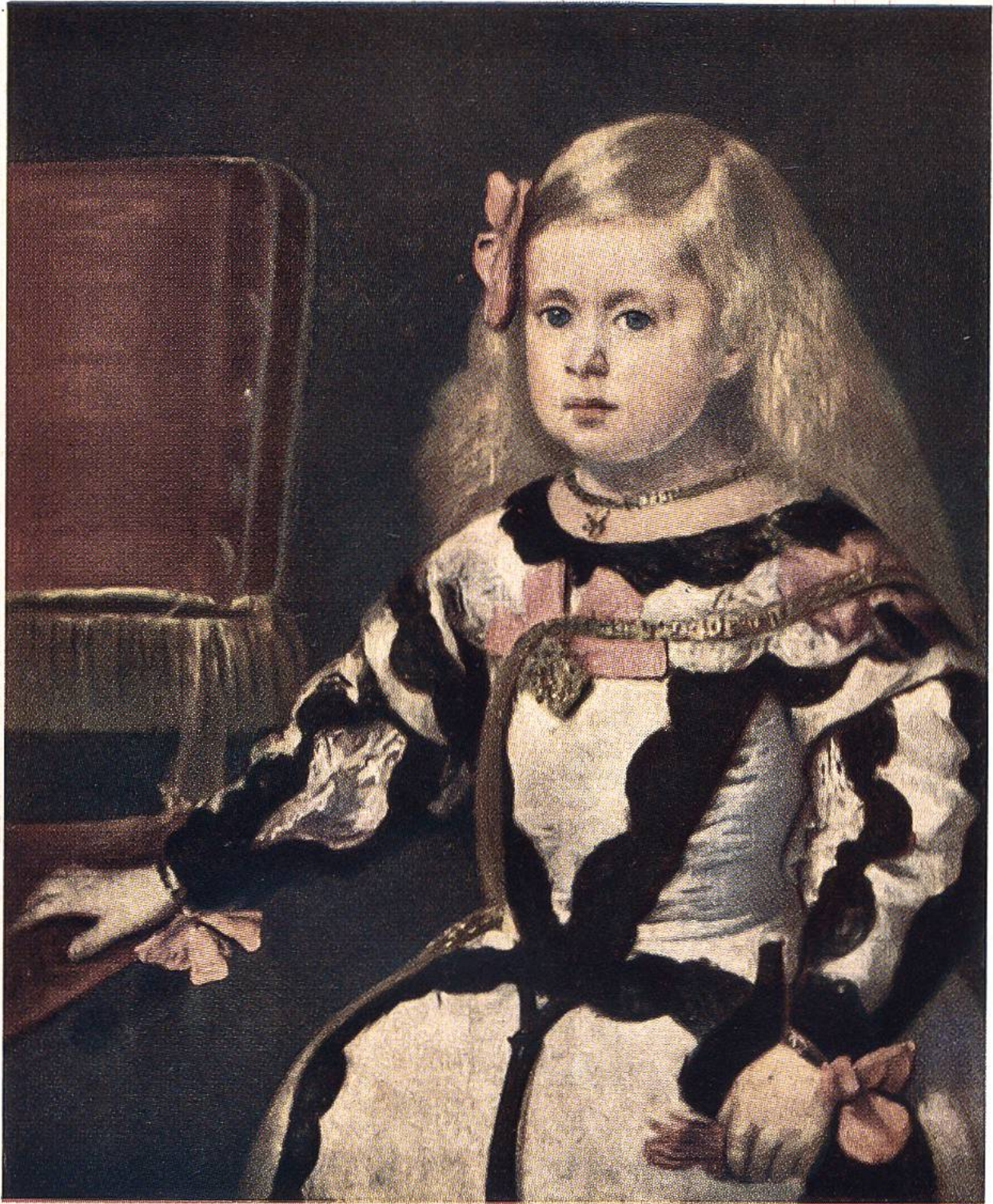
PRINZESSIN MARGUERITE, von Diego Velasquez, Sevilla, 1599–1660.