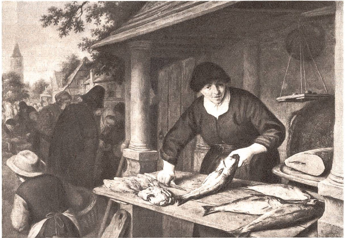
Fischverkäuferin, von Adriaen van Ostade, Haarlem, 1610—1685.