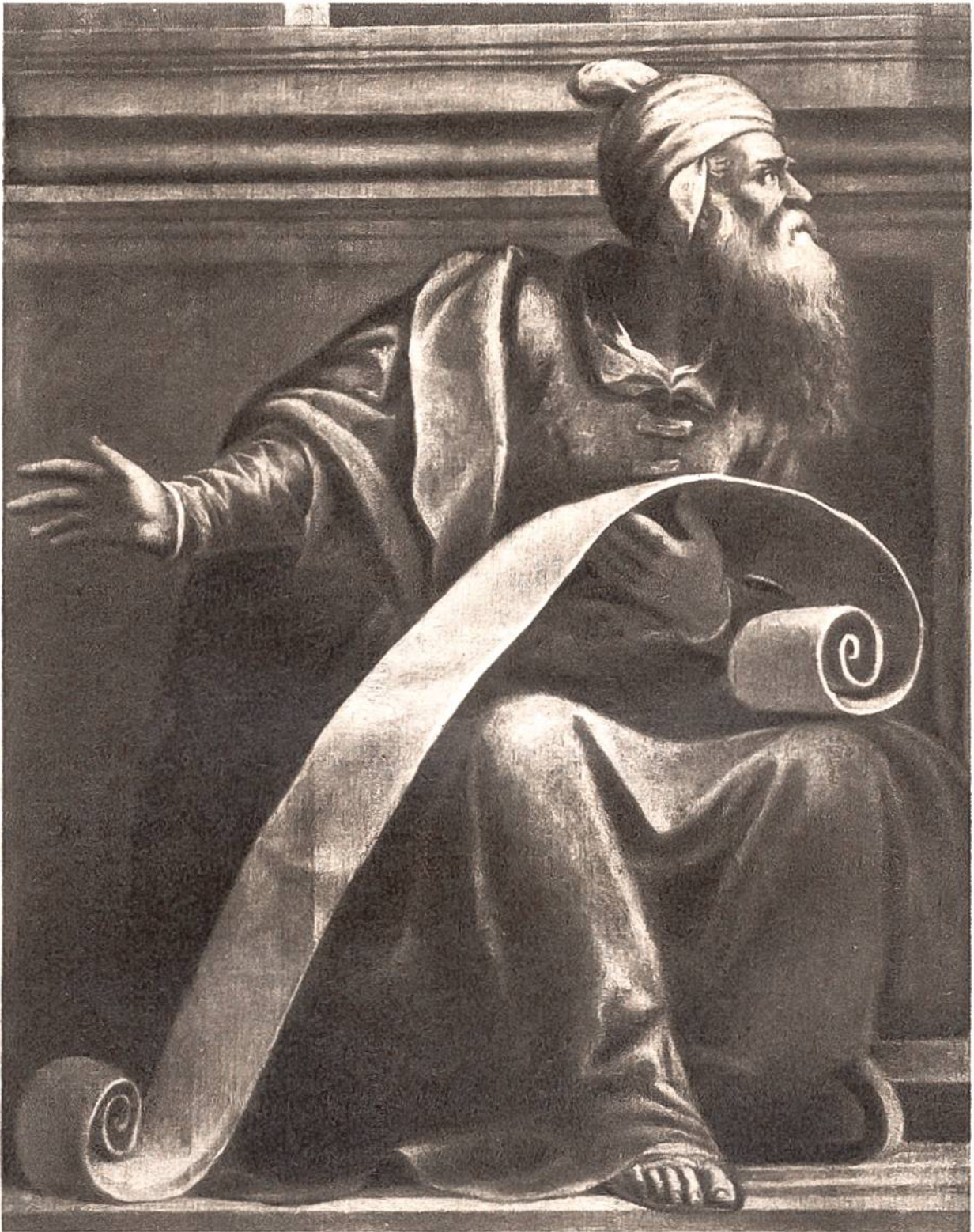
Prophet, von Marco Vecellio (Lieblingsschüler Tizians), Venedig, 1545—1616.