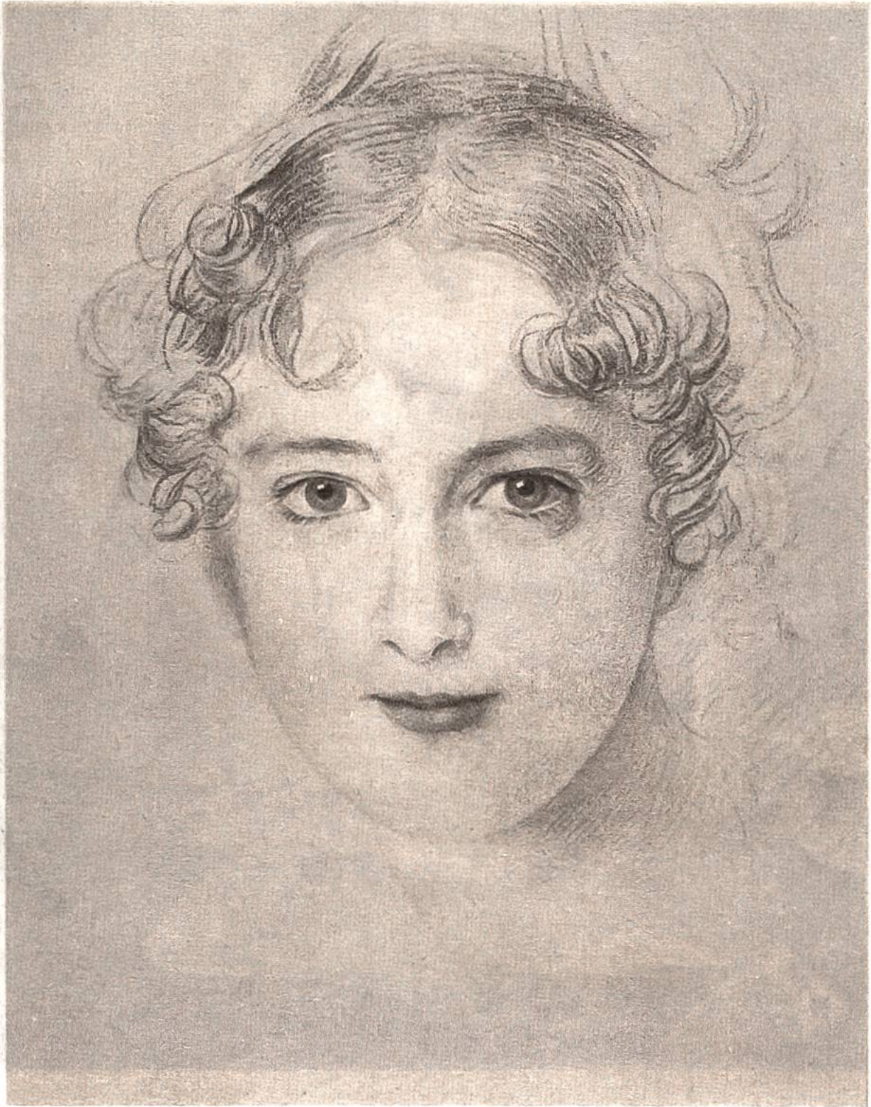
Junge Prinzessin, schwarze Kreidezeichnung von Thomas Lawrence, London, 1769—1830.