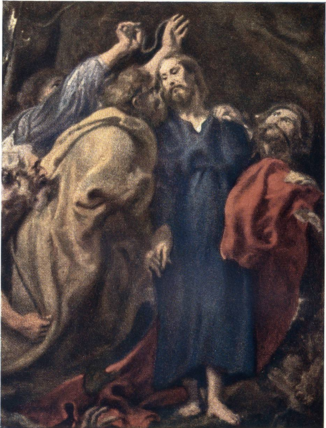
GEFANGENNAHME CHRISTI (Detail Judaskuss), von Anthonis van Dyck, Antwerpen, 1599–1641.