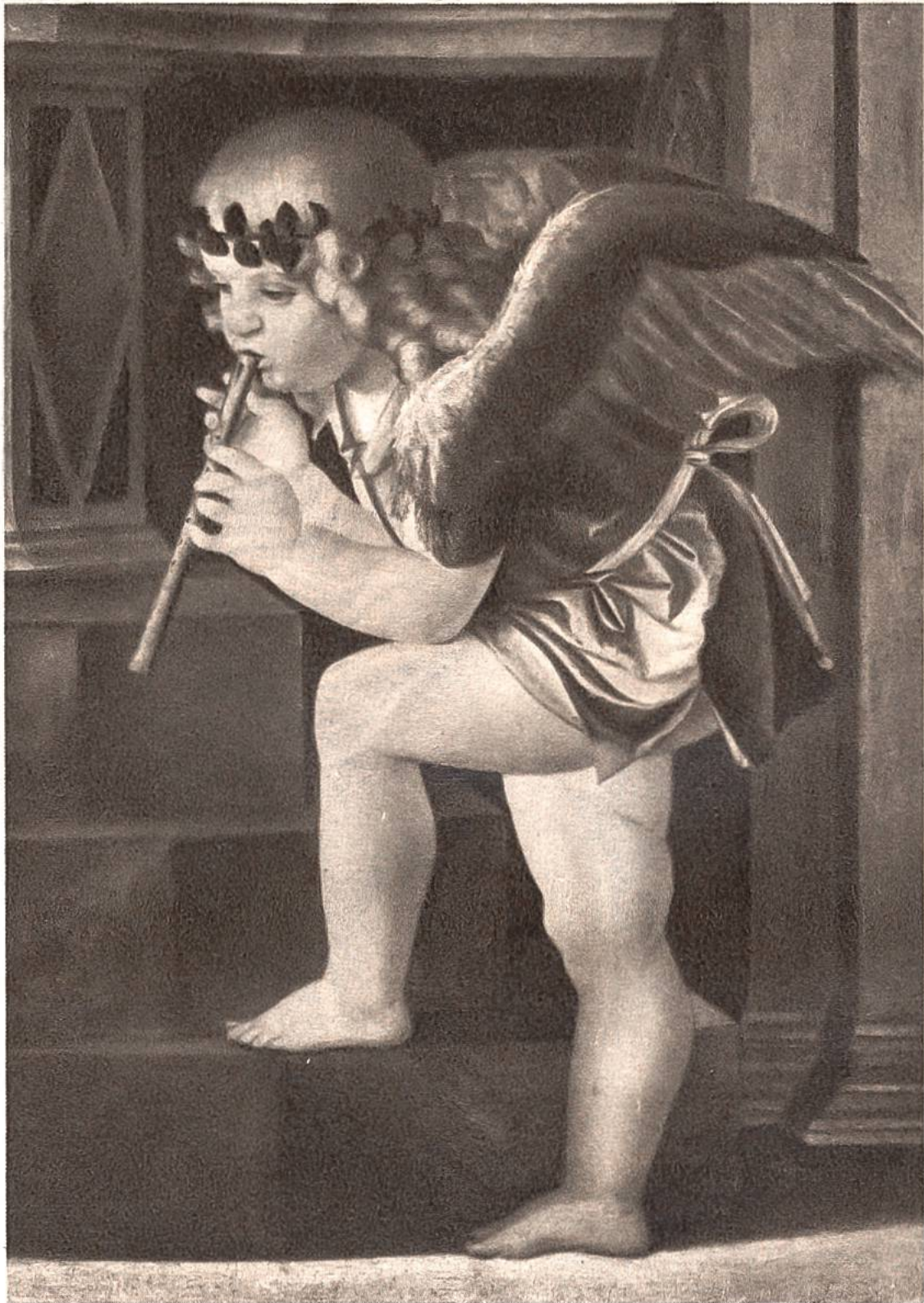
Engel, Teilstück des Madonnenbildes in der Kirche S. ta Maria dei Frari, Venedig, von Giovanni Bellini, Venedig, um 1430—1516.