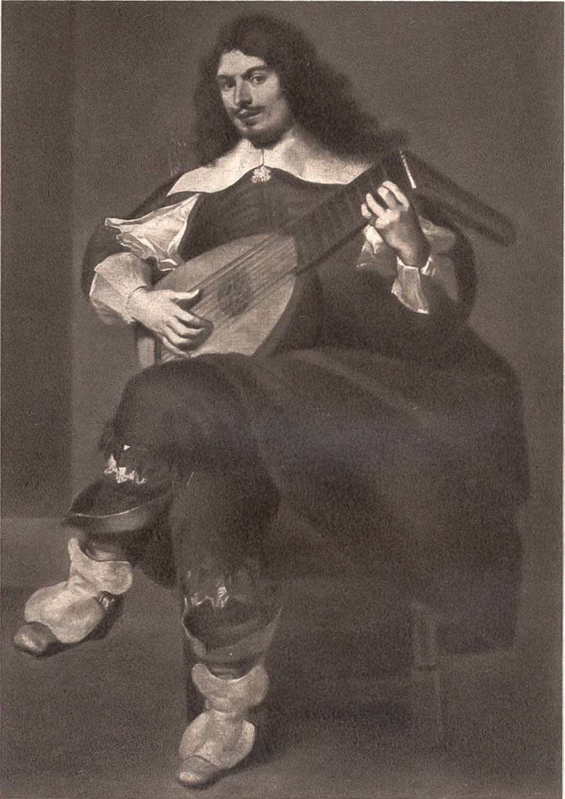
Der Gitarrespieler, von Anthonis van Dyck, Antwerpen, 1599—1641.