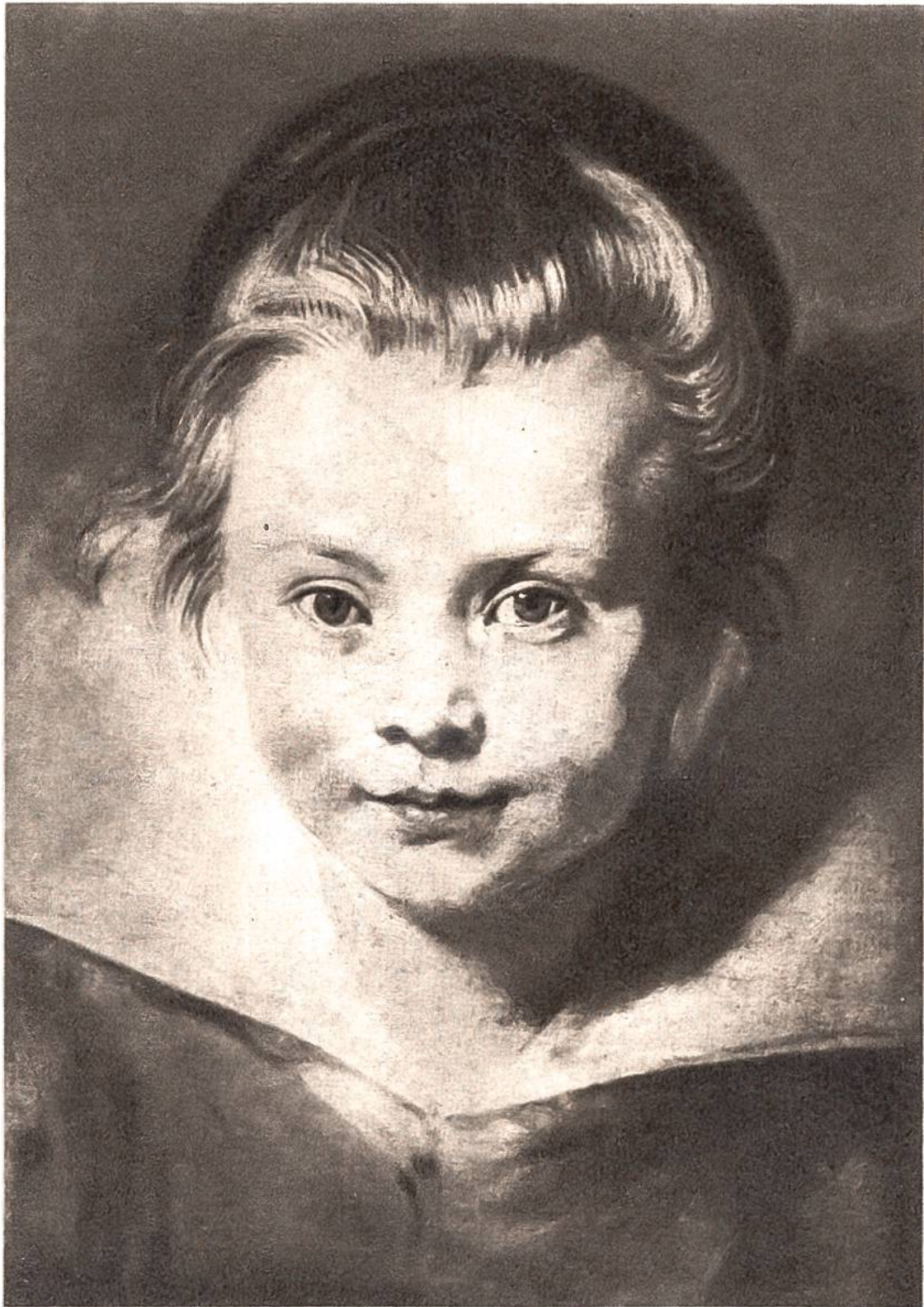
Mädchenkopf, von Peter Paul Rubens, Antwerpen, 1577—1640.