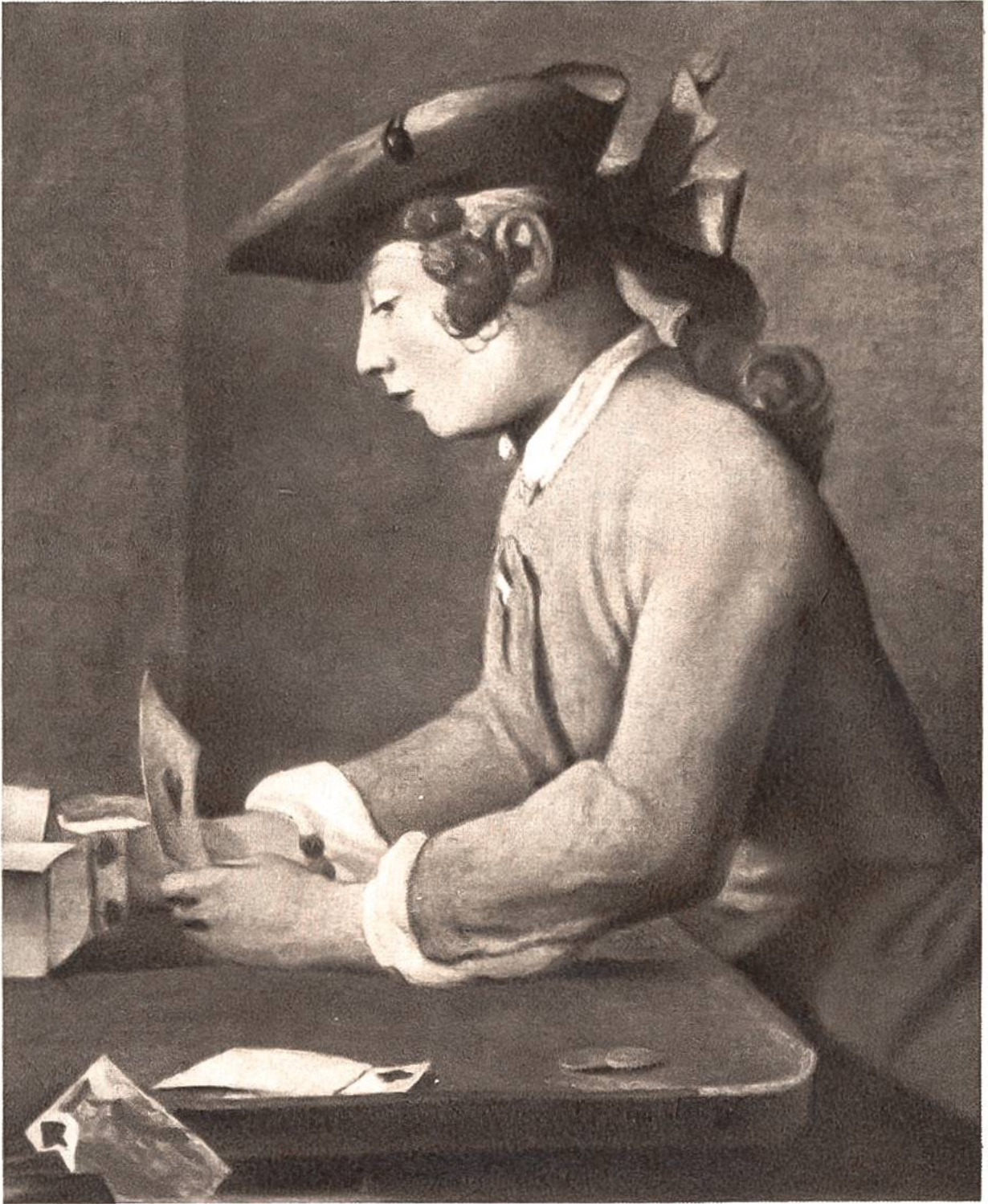
Der Kartenhausspieler, von J. B. S. Chardin, Paris, 1699—1779.