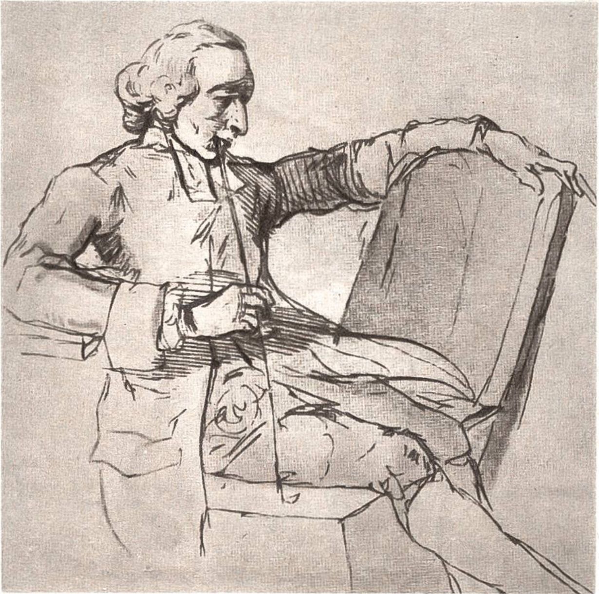
Pfeifenraucher, Federzeichnung von Johann Heinrich Füssli, Zürich, 1741—1825.