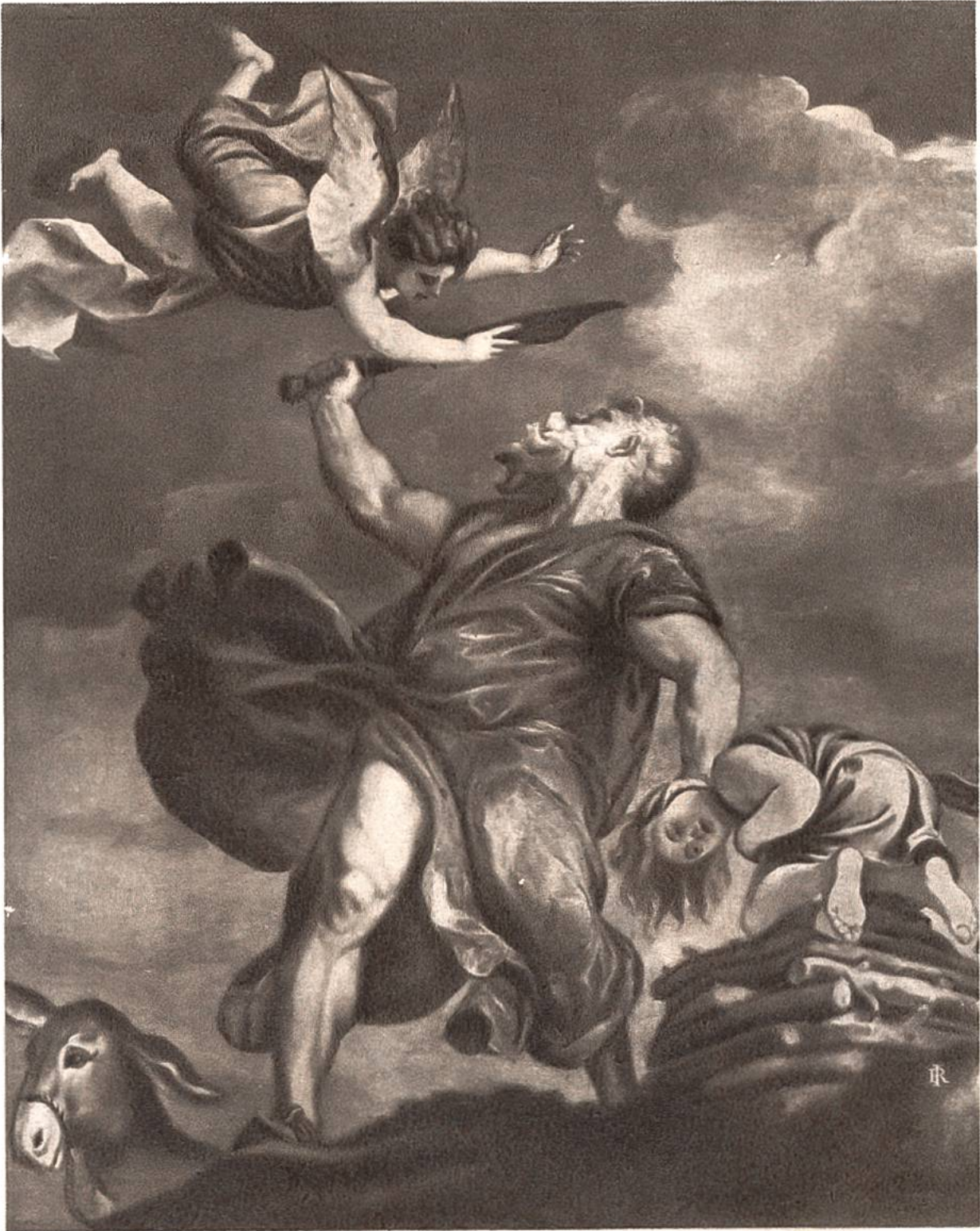
Abrahams Opfer, Deckengemälde von Tizian, Venedig, 1477—1576.