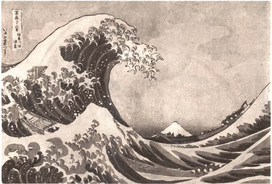
Welle vor dem Fujiyama, Farbenholzschnitt von Katsushika Hokusai, Yedo (Tokio), 1760—1849.