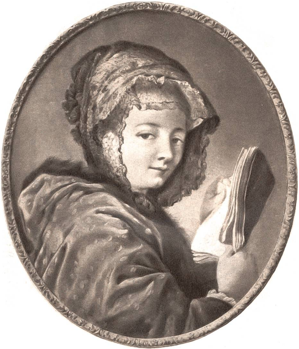
Junges Mädchen, von François Boucher, Paris, 1703—1770.