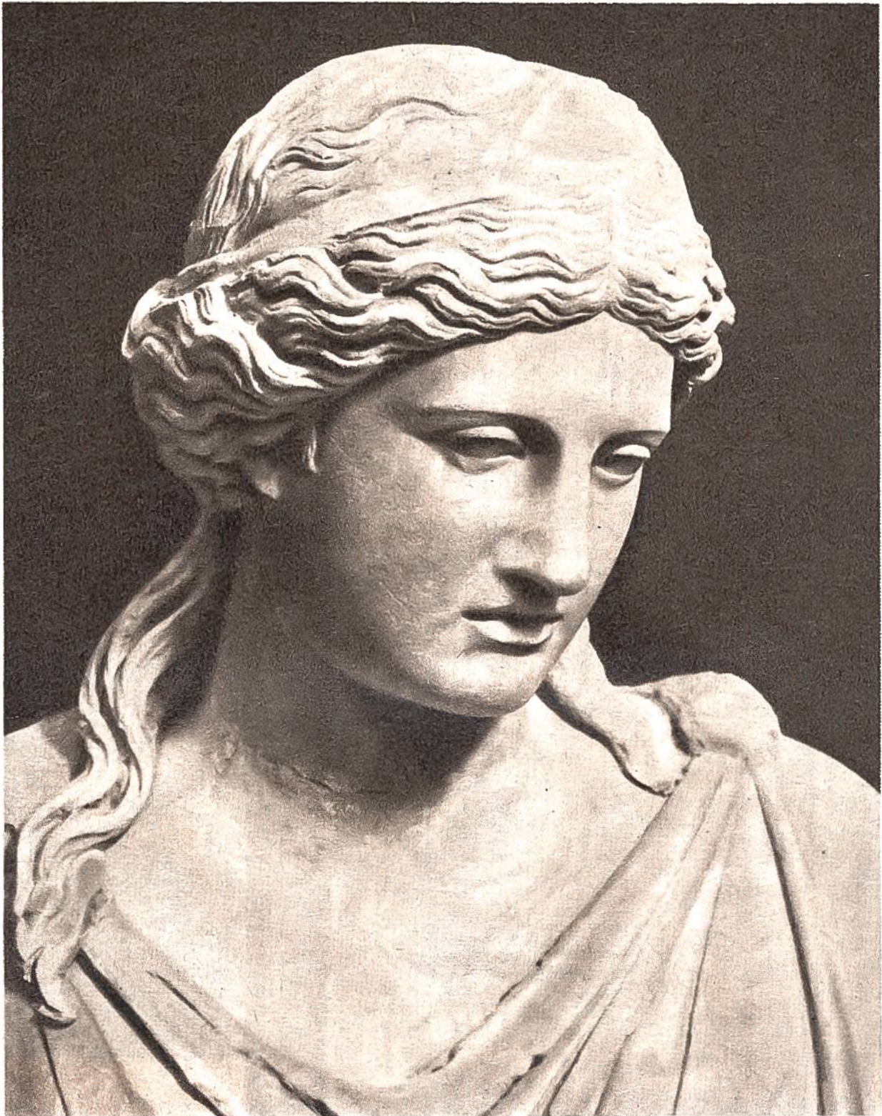
Kopf der Diana (altitalische Göttin des Lichts), antike Marmorbüste.