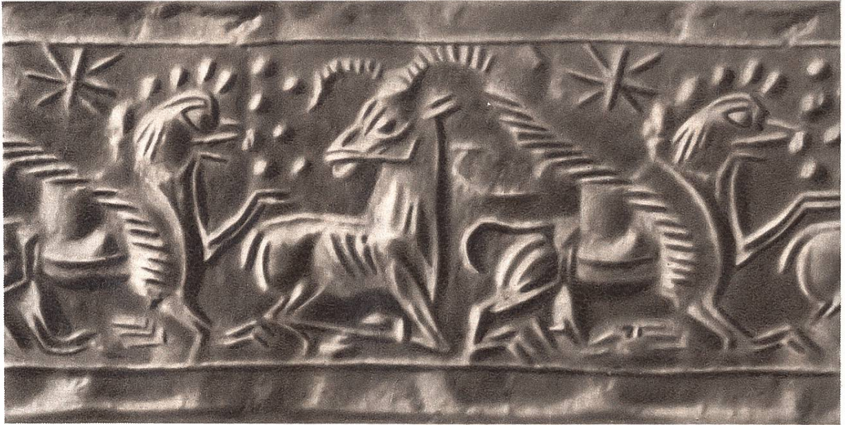
Zwei geflügelte Greife und ein Schafbock von einem assyrischen Siegelzylinder aus dem 12. Jahrhundert v. Chr.