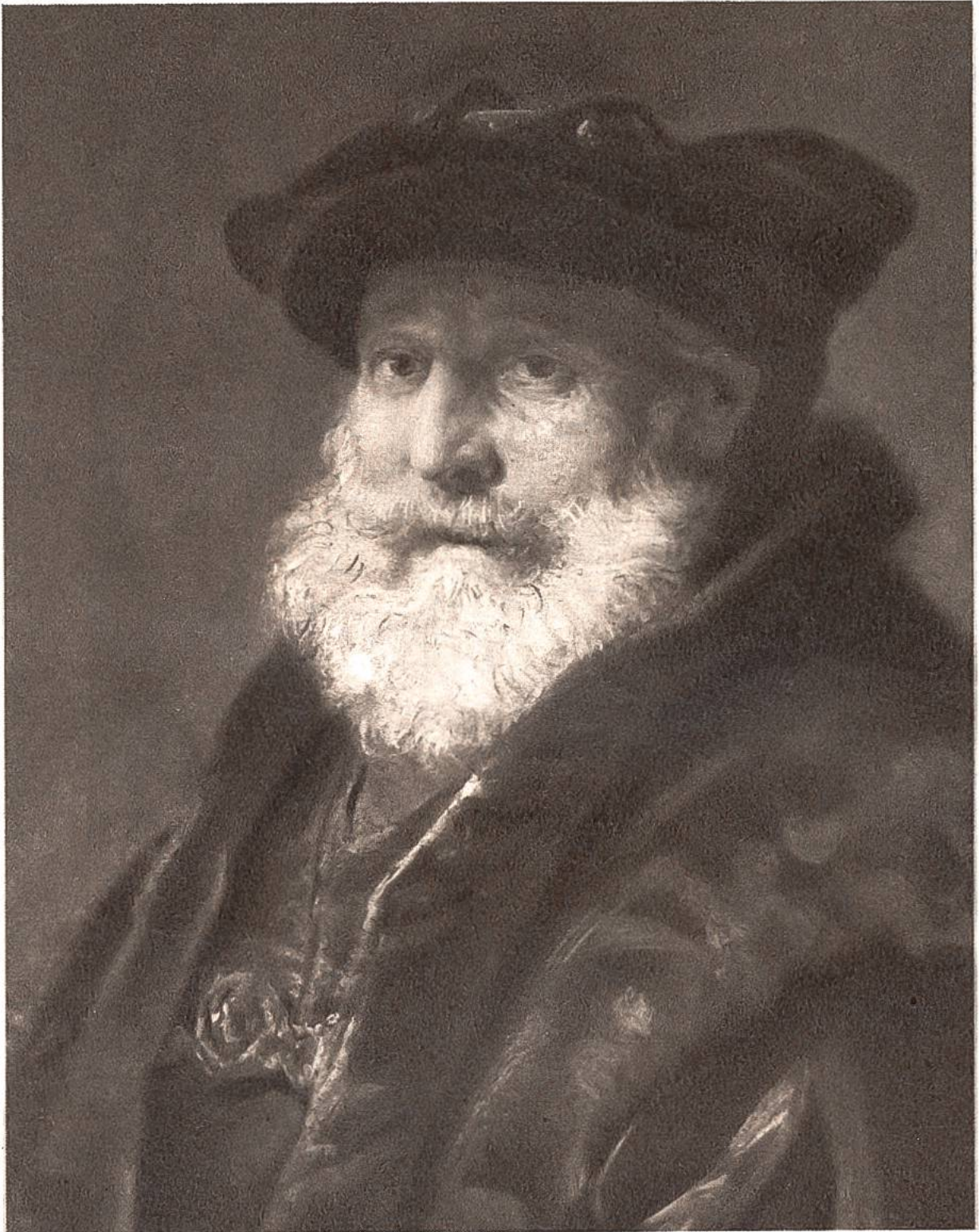
Männerbildnis, von Rembrandt van Rijn, Amsterdam, 1606—1669.