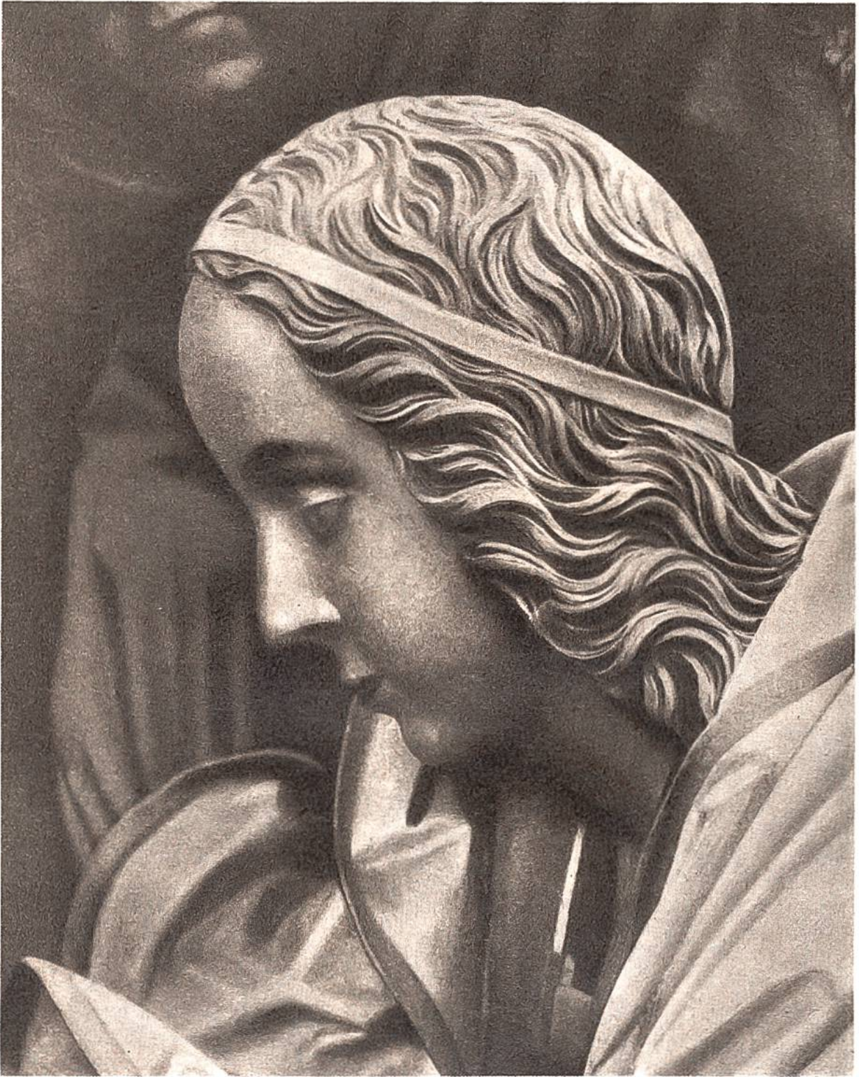
Maria vom Hochaltar in der Marienkirche zu Krakau, Holzbildwerk von Veit Stoss, Nürnberg, um 1440—1533.