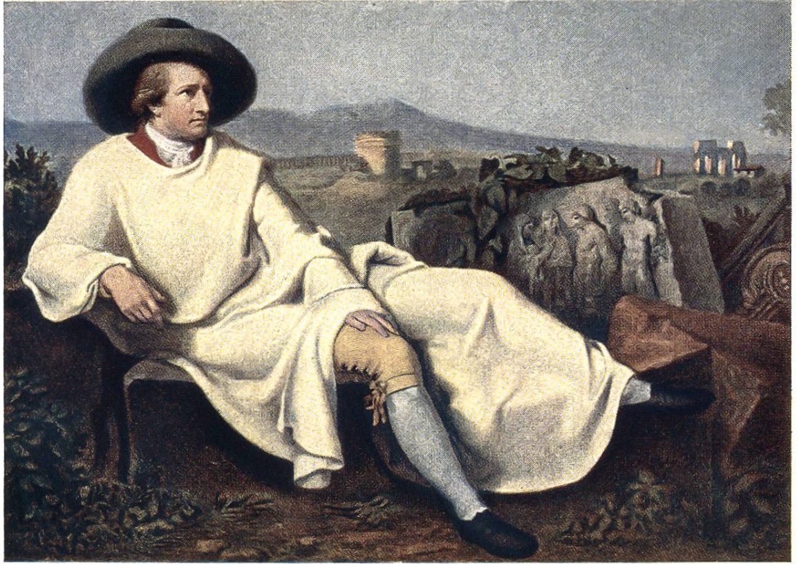
GOETHE IN DER CAMPAGNA (Italien), von J. H. W. Tischbein, genannt der Neapolitaner, 1751–1829.