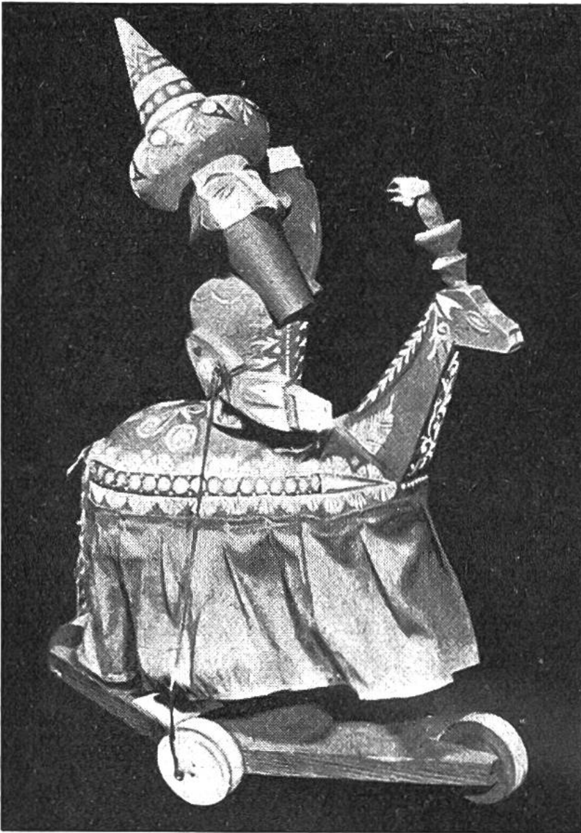
Ein chinesisches bewegliches Pupp- penspielzeug.

lichen Wesenheiten verloren hatte, konnte sie also zum Kinder-Spielzeug werden. Das altrömische Wort für ein Neugeborenes, „pupa“, wurde zum allgemein verwendeten Namen Puppe. Später setzte sich daneben das mittelalterliche Wort „tocke“ durch, welches wir in der Mundartbezeichnung Toggel wiedererkennen. Die ersten Spielpuppen wurden in Kindergräbern der Griechen und Römer, ganz vereinzelt auch in solchen der späten Ägypter gefunden. Im Mittelalter nahm ihre Hochschätzung zu, und der grosse Dichter Wolfram von Eschenbach pries sie zu verschiedenen Malen als Spielzeug seiner kleinen Tochter. Wie alte Bilder ersehen lassen, spielen alle Mädchen gern mit Puppen, besonders aber, wenn sie diese selbst kleiden können. Der deutsche Kaiser Karl V. liess 1530