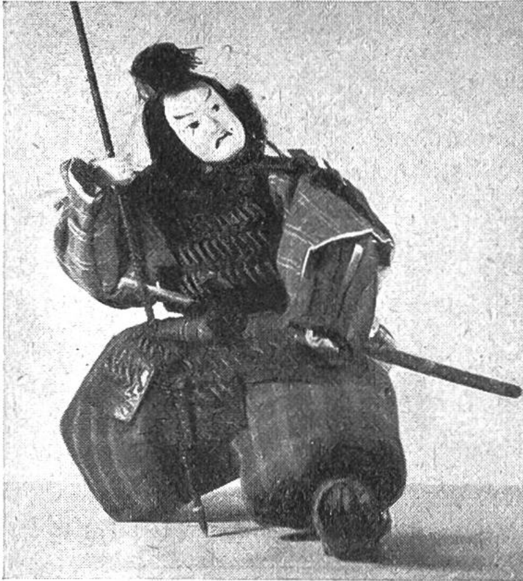
Eine japanische Kriegerpuppe.

trotz seiner Feindschaft gegenüber Frankreich aus Paris, das auf dem Puppenmarkt eine bevorzugte Stellung einnahm, für sein Töchterchen eine Puppe kommen und bezahlte einen hohen Preis.