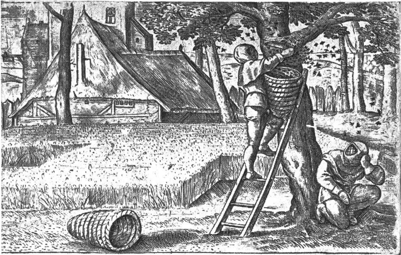
Einfangen eines Bienenschwarmes auf einem spätmittelalterlichen Bauernhof.