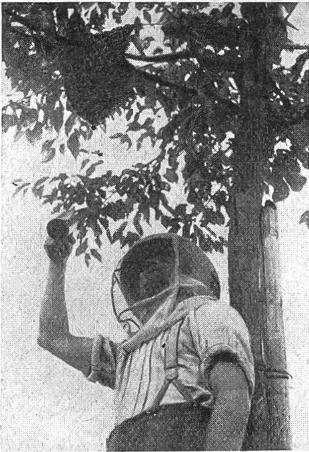
Ein Bienenschwarm ist ausgeflogen. Der Imker bestäubt ihn zum Beruhigen der Bienen mit Wasser.