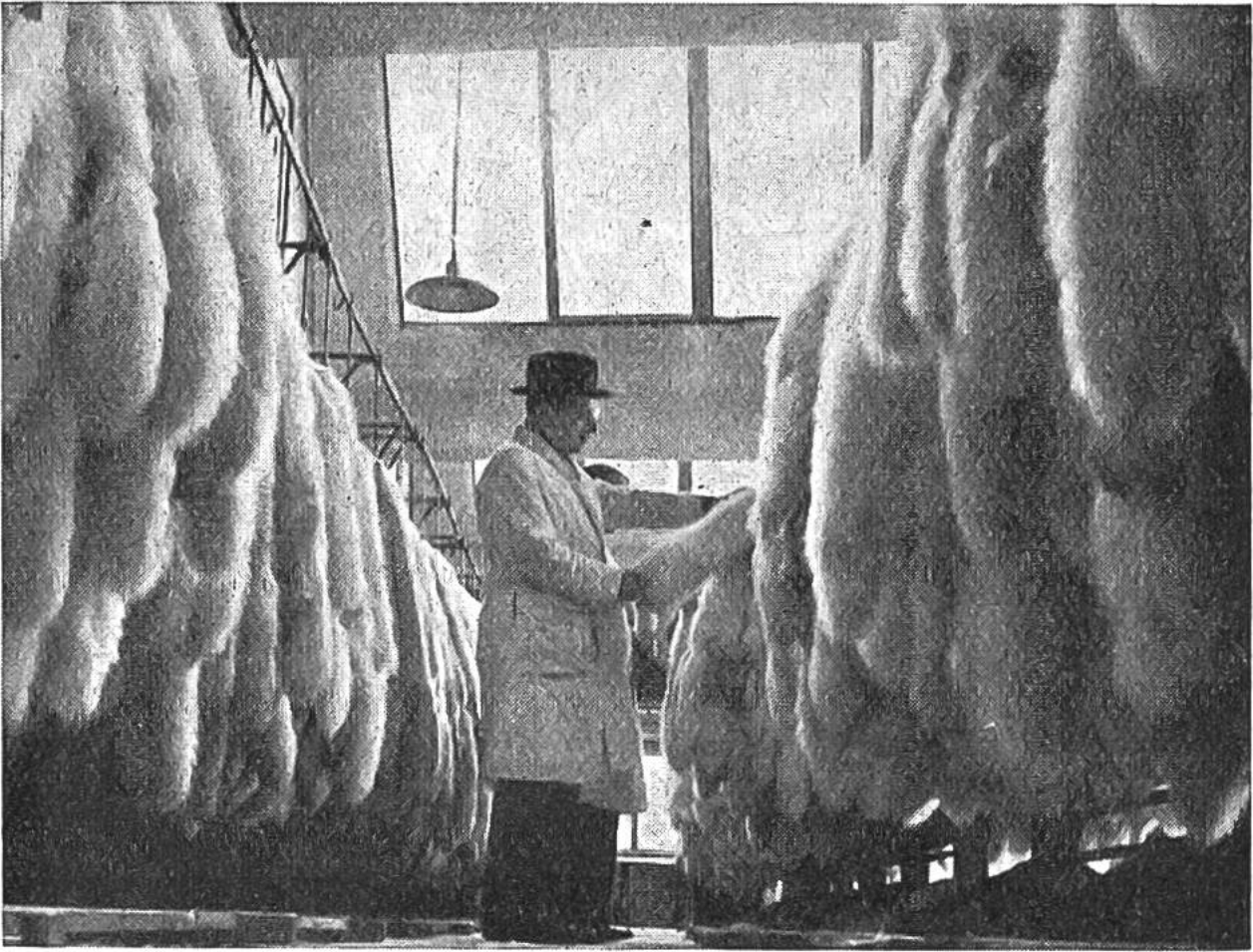
Ein Käufer prüft einen Posten Weissfüchse, der versteigert werden soll.