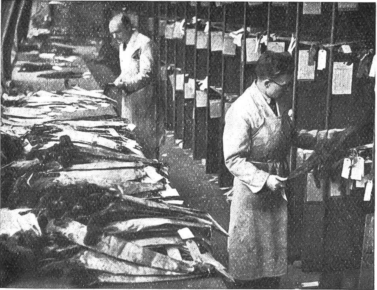
Spezialisten klassieren einzelne Nerzfelle.

reichen Büroangestellten, die telegraphisch mit aller Welt in Verbindung stehen, um Einkauf und Verkauf der kostbaren Felle zu regeln.