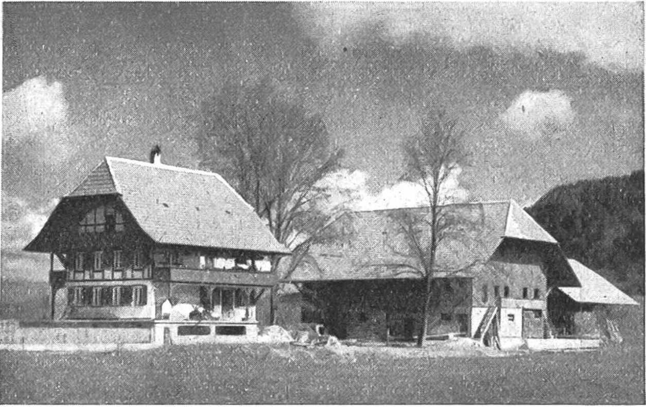
Neue Einzelhofsiedlung bei Gümmenen im Kanton Bern.