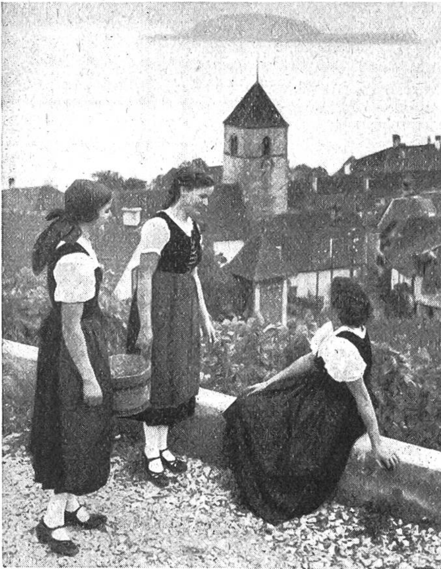
Weinlese ob Twann am Bielersee. Gassendorf des westschweiz. Weinbaugebietes.

Schweiz. Der in die heutige Westschweiz eingedrungene Germanenstamm der Burgunder war weniger zahlreich als die ungestümen Alemannen. Die Burgunder schonten die helvetischen Ansiedlungen und wurden als „hospes“ (Gäste – allerdings kaum sehr willkommene!) bei den Landesbewohnern einquartiert. Sprachlich und kulturell behielt jedoch die keltisch-römische Bevölkerung gegenüber dem fremden Eroberer die Oberhand. So wirken in diesem Landesteil die alten helvetischen Siedlungsformen bis auf den heutigen Tag nach. Typisch für viele romanische Siedlungen sind die engen Gassendörfer mit den in Reihen zusammengebauten Häusern. Die aus Stein erbauten Gassendörfer des welschen Weinbaugebietes drängen sich auf kleinem Raum zusammen, um möglichst wenig von dem höchst wertvollen Rebland zu be-