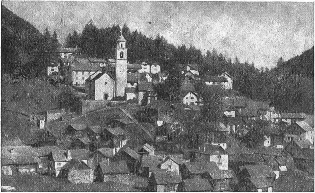
Soglio im Bergell. Haufendorf als Hangsiedlung. Man beachte die verschieden ausgerichteten Firsten im Vergleich zu Gluringen.

hof, Weiler und Dorf. Die Art und die Grösse der Siedlung hängt von den naturbedingten Verhältnissen, von der Verkehrslage und von der geschichtlichen Entwicklung einer Gegend ab. Es gibt in der Schweiz Gemeinwesen, die sich bis zu den ersten Niederlassungen der Pfahlbauer zurückverfolgen lassen. Der Standort vieler blühender Siedlungen wurde also schon von längst ausgestorbenen Völkern bestimmt.