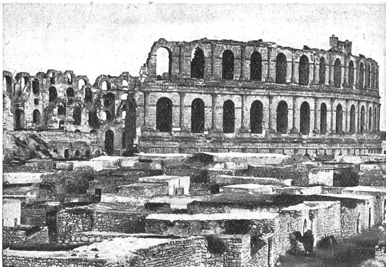
Die gewaltigen Ausmasse des römischen Amphitheaters zu El Djem erkennt man beim Vergleich mit dem „Wüstenschiff“, einem Kamel in der rechten unteren Bildecke.

dass diese Strassen in der Nähe der Küste – denn so weit ist der Sand schon vorgedrungen – hier und dort über völlig verschüttete Kulturstätten hinlaufen. Eine solche ist die mit einer fünfzehn Meter hohen Sandschicht bedeckte Römerstadt Leptis Magna. Von ihrem Bestehen gaben bis zum Jahre 1923 fast nur der Leuchtturm und die Hafenanlagen Kunde, welche von den Wogen des Mittelmeers immer wieder freigespült wurden. Die Ausgrabungen unter der Leitung von Forschern, die sich hingebungsvoll um die Vorgeschichte der italienischen Kolonien bemühten, förderten darauf Wunder über Wunder zutage: ungezählte Säulen, Reliefs und Standbilder aus Marmor, gepflasterte Strassen, Zisterne, Wasserleitung, Thermen, Gerichtshalle, Stadttor und Kaiserpalast. Eine Stadt, an dokumentarischem und künstlerischem Wert vielleicht bedeutsamer noch als die unter Lava und Asche verschüttete süditalienische Stadt Pompeji.