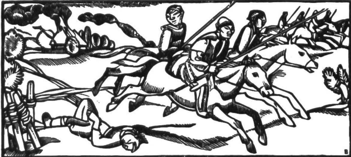
Mongolenvölker dringen in Europa ein.

oberung Galliens durch Julius Cäsar. 49–45 Bürgerkrieg zw. Cäsar u. Pompejus. Triumvirat. 44 Ermordung Cäsars. 30–476 n. Chr. Rom unter Kaisern. 29 Augustus röm. Kaiser. Blüte der römisch. Literatur. Virgil, Ovid, Horaz, Titus Livius. Nach Christus. 9 Der röm. Feldherr Quintilius Varus wird vom Cheruskerfürsten Arminius (Hermann) im Teutoburgerwalde besiegt. 64–311 Zeit der Christenverfolgungen durch verschiedene römische Kaiser. 69 Helvetischer Aufstand, Julius Alpinus. 313 Kaiser Konstantin erhebt das Christentum z. Staatsreligion. 337 Teilung des röm. Reiches. 375 Beginn d. Völkerwanderung.