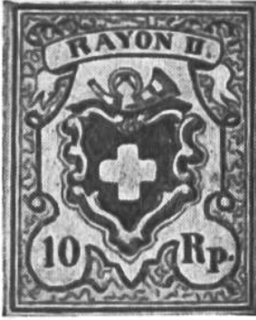
Eine der ersten eidgenössischen Briefmarken.

ihres Standes gekleidet, und an den in Form und Anstrich ungleichen Postkutschen prangten die Kantonswappen. Immerhin waren die Postverbindungen nun erheblich verbessert. Zwischen den Kantonshauptorten verkehrte täglich mindestens eine Pferdepost. Die Reise von Zürich nach Basel kostete 1842 im Wagennern Fr. 7.20 alter Währung, von Zürich nach Genf Fr. 25.40. Von Luzern gelangte man schon in 31 ½ Stunden nach Mailand und bezahlte dafür Fr. 28.40 (= ca. Fr. 40.— neue Währung). Auf den wichtigsten Strecken fuhren ausser den gewöhnlichen Posten noch Eilwagen.