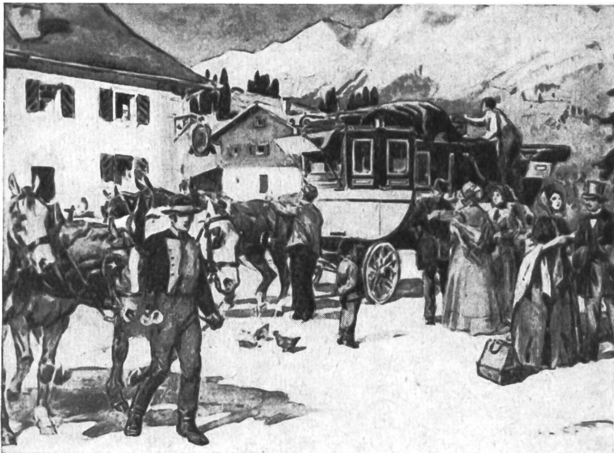
Alpenpoststation um 1860.

Seit dem 17. Jahrhundert bis 1798 bestanden in der Schweiz fünf voneinander unabhängige Postanstalten, nämlich die bernische Post der Familie Fischer (in Bern und den bernischen Untertanenländern, Solothurn, Neuenburg, Freiburg, Wallis, Genf, Luzern und Unterwalden), ferner die Posten der kaufmännischen Direktorien von Basel, Zürich und St. Gallen sowie der Familie Thurn und Taxis in Schaffhausen. Diese Posten waren nach dem Untergang der alten Eidgenossenschaft in ihrer bisherigen Gestalt bedroht, weil die helvetische Republik nur ein einziges Postgebiet dulden, den Betrieb entsprechend vereinfachen und die Taxen verbilligen wollte. Dies hätte