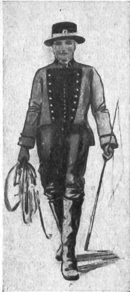
Postillon um 1860.