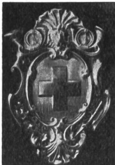
Versilbertes Brust-Anhängeschild eines „Postkondukteurs“.

alle Kantone das Postwesen in eigenen Betrieb. Aber noch immer suchte jede Verwaltung bei den Tarifen und bei der Einrichtung von Postkursen ihren Vorteil zu wahren. Jeder Brief musste einzeln von einer kantonalen Post zur andern weiterberechnet werden; von Genf bis St. Gallen z. B. ging ein Brief durch acht verschiedene Postgebiete. Wurde eine Sendung ausserhalb eines Postortes dem Boten übergeben und ging sie an einen Empfänger, der in einem andern Kanton ebenfalls abseits wohnte, so waren meistens Zuschläge zu entrichten. So konnte denn die Taxe eines Briefes von 20 g, an der heutigen Kaufkraft des Geldes gemessen, bis zu 3 und 4 Fr. betragen. Man kann sich denken, was unter solchen Verhältnissen Briefe aus überseeischen Ländern kosteten.