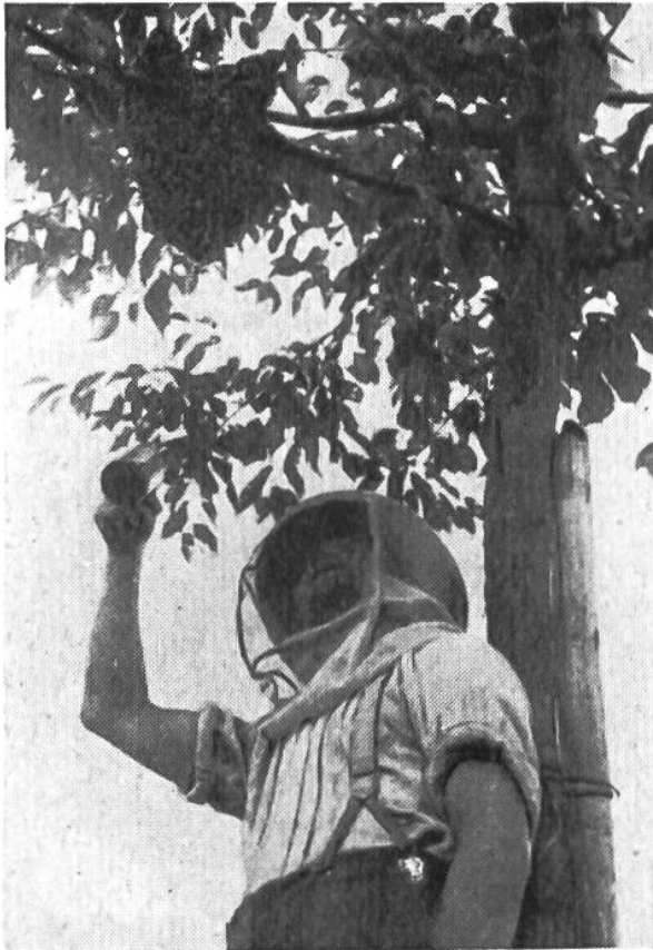
Ein Bienenschwarm ist ausgeflogen. Der Imker bestäubt ihn zum Beruhigen der Bienen mit Wasser.