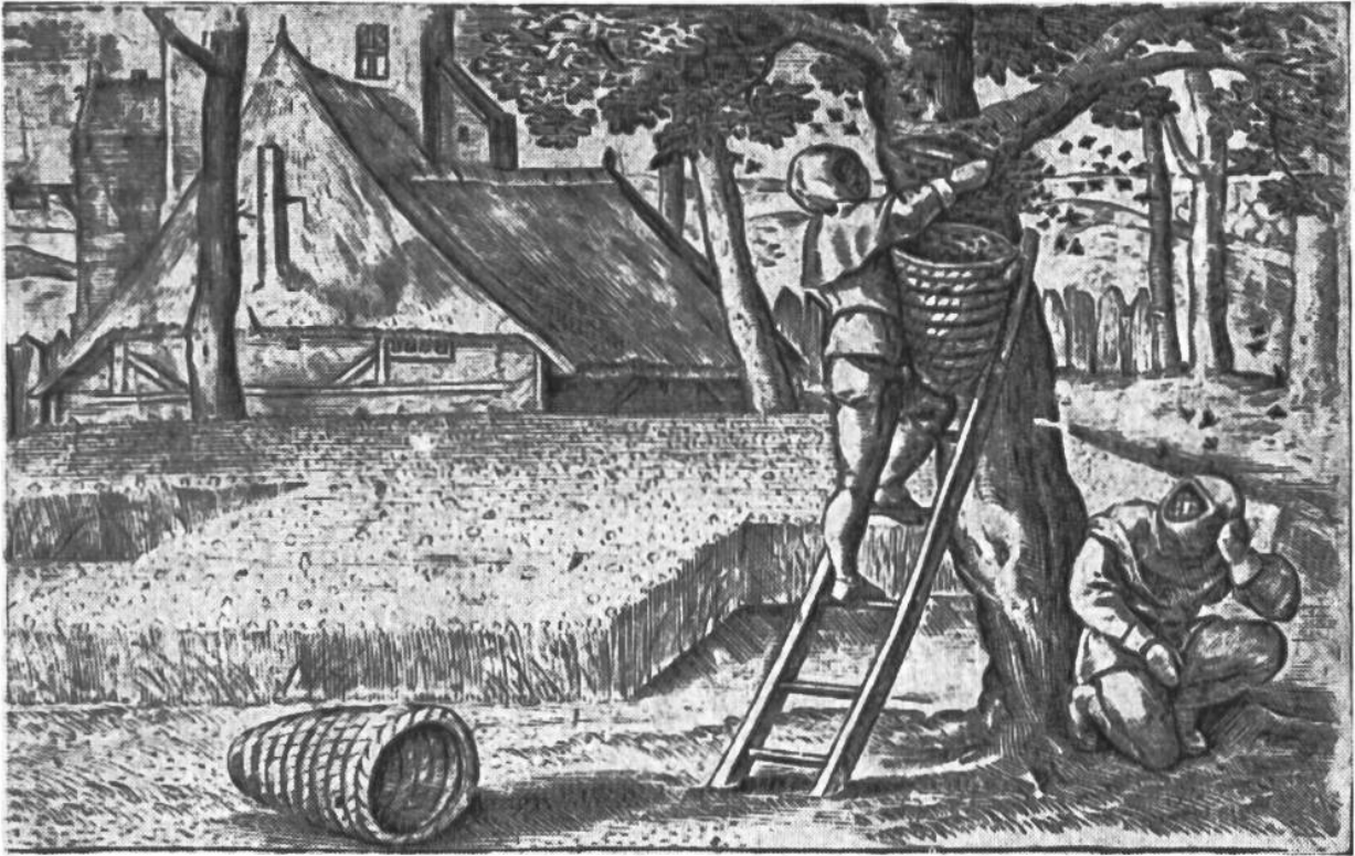
Einfangen eines Bienenschwarms auf einem spätmittelalterlichen Bauernhof.