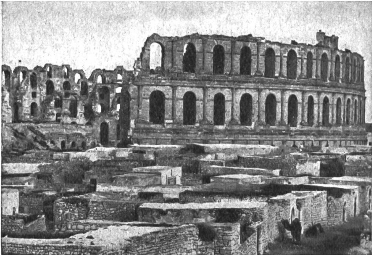
Die gewaltigen Ausmasse des römischen Amphitheaters zu El Djem erkennt man beim Vergleich mit dem „Wüstenschiff“, einem Kamel in der rechten unteren Bildecke.

dass diese Strassen in der Nähe der Küste – denn so weit ist der Sand schon vorgedrungen – hier und dort über völlig verschüttete Kulturstätten hinlaufen. Eine solche ist die mit einer fünfzehn Meter hohen Sandschicht bedeckte Römerstadt Leptis Magna. Von ihrem Bestehen gaben bis zum Jahre 1923 fast nur der Leuchtturm und die Hafenanlagen Kunde, welche von den Wogen des Mittelmeers immer wieder freigespült wurden. Die Ausgrabungen unter der Leitung von Forschern, die sich hingebungsvoll um die Vorgeschichte der italienischen Kolonien bemühten, förderten darauf Wunder über Wunder zutage: ungezählte Säulen, Reliefs und Standbilder aus Marmor, gepflasterte Strassen, Zisterne, Wasserleitung, Thermen, Gerichtshalle, Stadttor und Kaiserpalast. Eine Stadt, an dokumentarischem und künstlerischem Wert vielleicht bedeutsamer noch als die unter Lava und Asche verschüttete süditalienische Stadt Pompeji.