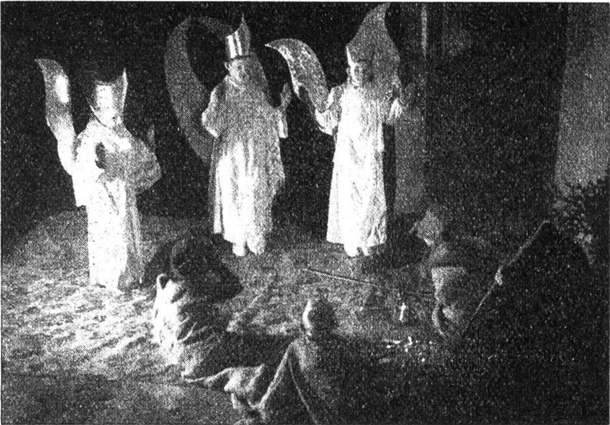
Drei Engel verkünden den Hirten die frohe Botschaft: „Freuet euch...“. Szene aus einem Weihnachtsspiel in der Innerschweiz.