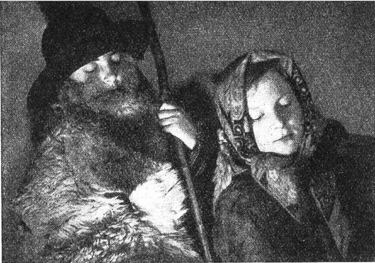
Maria und Josef hören andächtig dem Lobgesang der Könige und Hirten zu.

Gerade wegen der einfachen, schlichten Darstellungsweise liegt ein ganz eigentümlicher Zauber über diesem Spiel, eine Weihe besonderer Art, wie sie selten in den Theatern der Städte zu finden ist.