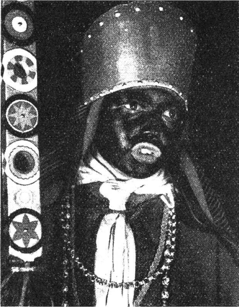
Der Mohren- könig, darge- stellt von einem Schüler aus der Innerschweiz.

obern Schulzimmer her tönt leise ein Kindersang mit Orgelton.