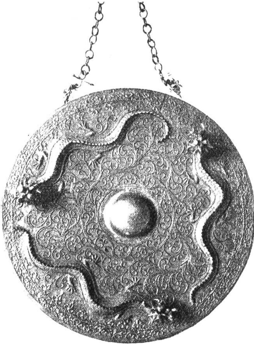
Gong von der Südseeinsel Borneo, ein kunstvoll gearbeitetes Schlagbeken aus Bronze.