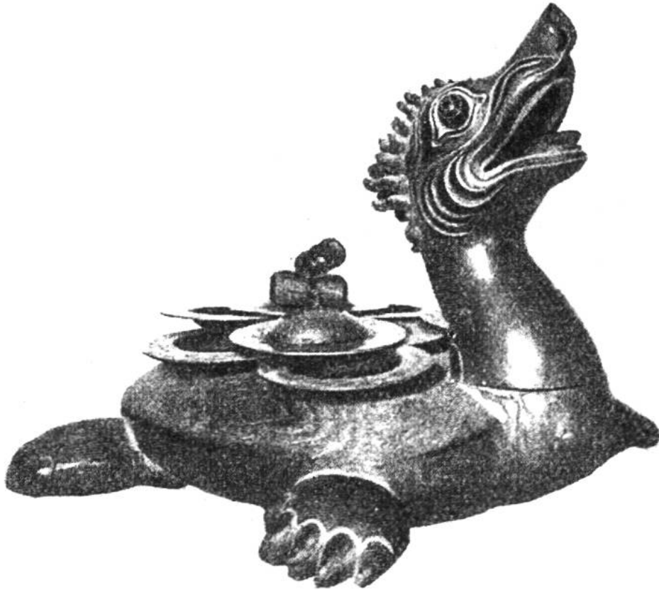
Balinesisches Musikinstrument aus hartem, braunem Holz und Messing.

schauungen und Überlieferungen und war darum schön und echt.