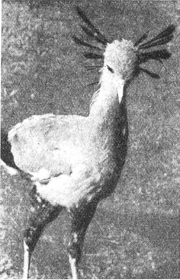
Der Sekretär, ein Raubvogel mit Stelzbeinen.

Vogel-immer auf beiden Beinen – inmitten der dekorativen grünen Papyrusstauden, die sich weit über ihm zusammenfügen, zwischen herrlich duftenden blauen Seerosen, stundenlang zuweilen, ohne sich zu bewegen. Plötzlich setzt er auf dem sumpfigen Boden sorgfältig Fuss vor Fuss, geht ein paar Schritte mit weitgespreizten, langen Zehen – und mit einem Mal schießt der gewaltige Schnabel vor und packt einen zappelnden Lungenfisch, der die Hauptnahrung des Schuhschnabels bildet. Sein Nest hat übrigens bis heute noch kein Weisser zu sehen be-