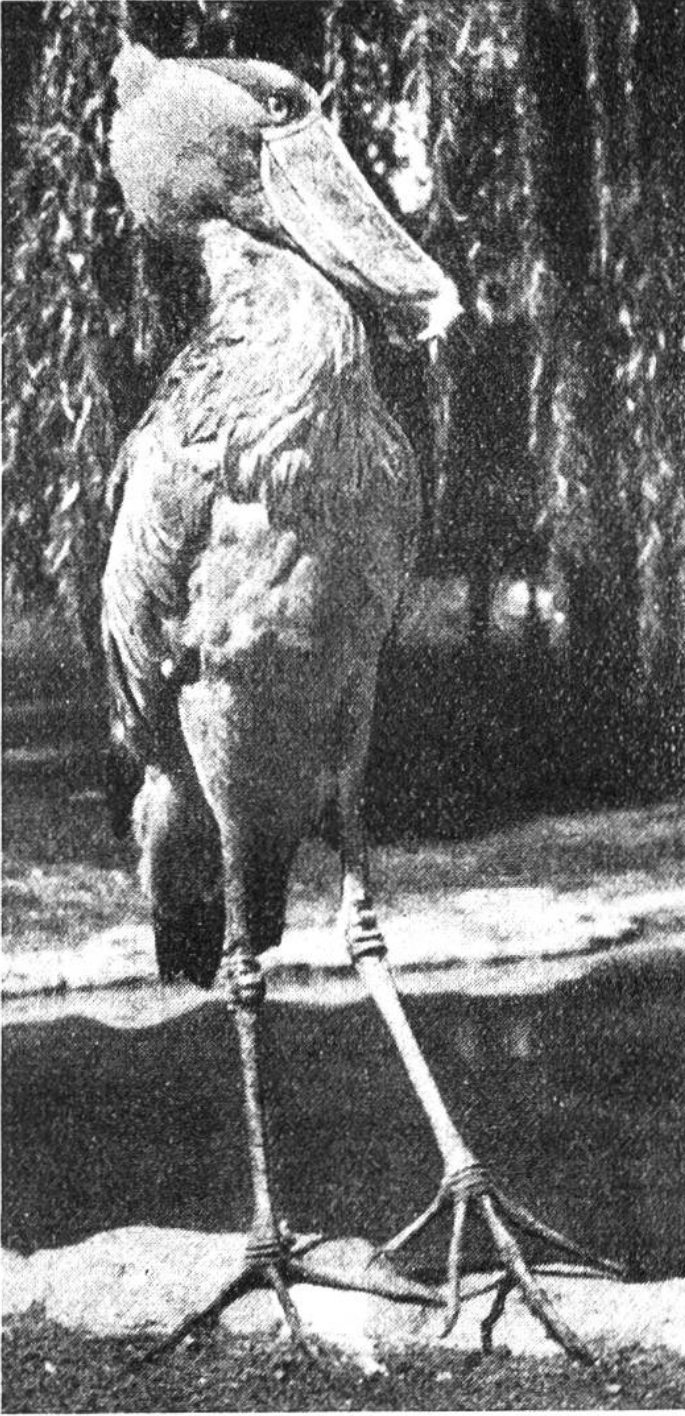
Schuh schnabel (Abu Markub).

Beginnen wir mit dem Schuhschnabel. Er ist so selten, dass er in ganz Afrika unter strengem Schutz steht. Heute lebt er in den schwer zugänglichen Papyrus-sümpfen zwischen Nil und Kongo und im Gebiet der Nilquellen, während er früher auch am Unterlauf des Nils bis in die Gegend von Kairo verbreitet war. Wie sein Name andeutet, ist das Auffälligste an diesem Vogel der riesenhafte Schnabel, welcher schuhförmig aussieht. In allen Sprachen nimmt die Bezeichnung dieses Vogels Bezug auf seinen Schnabel, sogar in der wissenschaftlichen lateinischen Benennung. Da heisst der Vogel Balae-niceps rex , der Walköpfige, und rex bedeutet königlich. In seiner Haltung und gemessenen