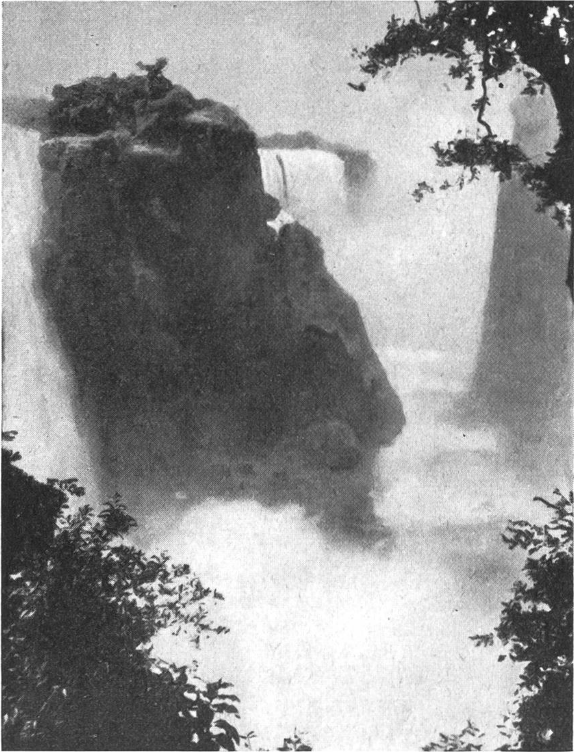
Blick aus dem vom Sprühregen reich bewässerten „Regenwald“ auf die gegenüberliegenden herrlichen Viktoriafälle.

das Getöse der stürzenden Wassermassen – zur Regenzeit 450 000 m 3 in der Minute – viele Meilen weit zu vernehmen, indessen das Auge aus derselben Entfernung eine riesige rauchähnliche Wolke erblickt; es ist der sprühende Gischt, der sich in eine Höhe von dreihundert Metern aus dem von weissem Schaum durchbrodelten Cañon erhebt. H. Sg.