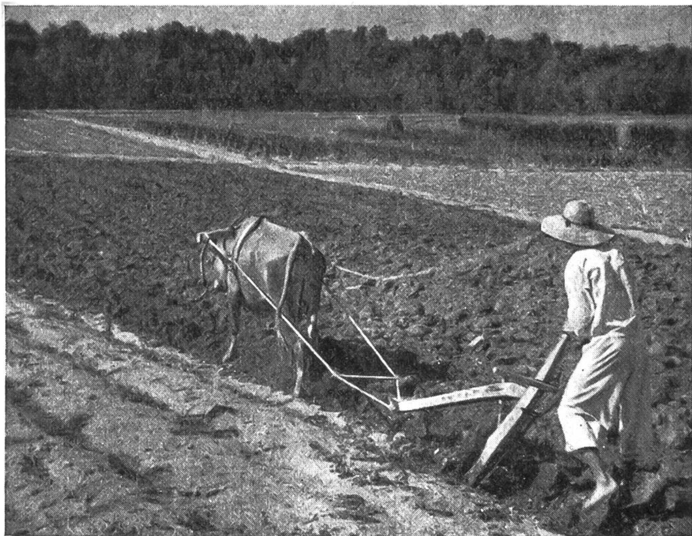
Ein Bild des Friedens. Koreanischer Bauer beim Pflügen mit einem altertümlichen, von einem Büffel gezogenen Pflug.