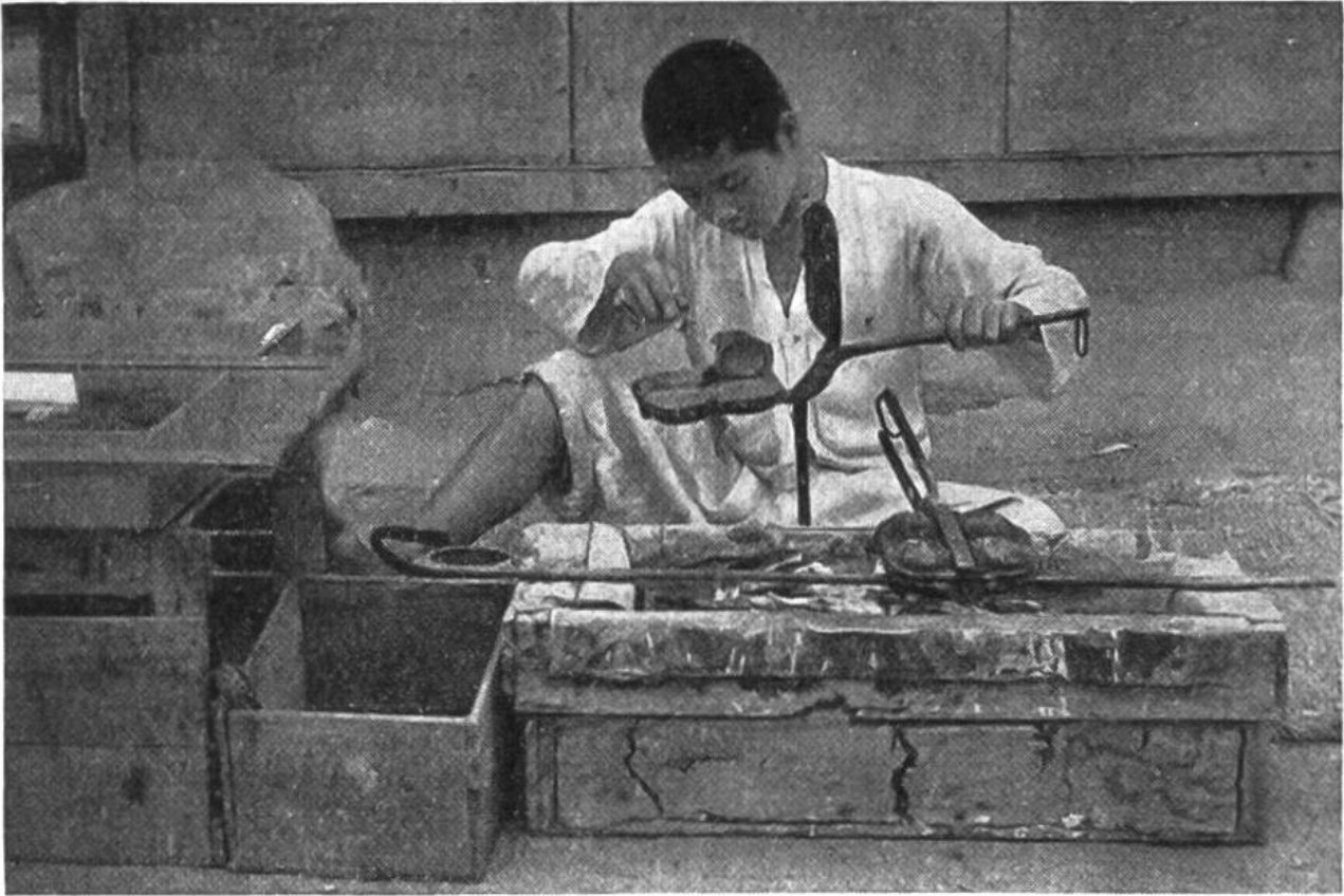
Dieser Jüngling bäckt mit seinem Waffeleisen Reiskuchen, die er an die Vorübergehenden verkauft.

entzogenen Pflanzennährstoffe oft nicht durch genügende Düngung zu ersetzen. Auf Kopf und Rücken schleppt er seine wenigen Erzeugnisse zum Händler oder auf den Markt, wo er sich meist mit einem recht bescheidenen Erlös zufrieden geben muss. Trotz unablässigem Mühen bringt es der koreanische Bauer daher nur selten zu einigem Wohlstand. A. B.