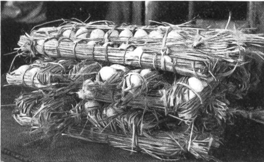
Originell mutet diese koreanische Verpackungsart der Hühnereier an.

entzogenen Pflanzennährstoffe oft nicht durch genügende Düngung zu ersetzen. Auf Kopf und Rücken schleppt er seine wenigen Erzeugnisse zum Händler oder auf den Markt, wo er sich meist mit einem recht bescheidenen Erlös zufrieden geben muss. Trotz unablässigem Mühen bringt es der koreanische Bauer daher nur selten zu einigem Wohlstand. A. B.