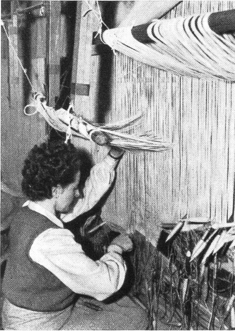
Eine Gobelin- Wirkerin bei der Hautelisse-Arbeit.