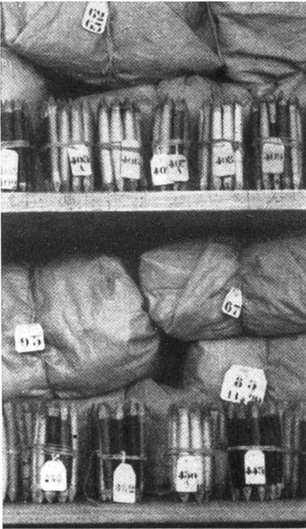
Gefärbte Wolle in Säcken und auf Spulen wartet auf ihre Verwendung.

belin“ erhielt. Noch heute werden die Gobelins nach demselben Verfahren hergestellt wie vor mehreren hundert Jahren: sie werden immer noch von Hand gewirkt. Die technische Seite der Gobelin-Industrie hat sich allerdings sehr vervollkommnet, und die Farbabstufungen haben sich durch chemische Mittel bis zu einer Skala von 15 000 und mehr Tönen erweitert, ein Umstand, der dazu führte, gemalte Bilder, also Gemälde, bis aufs kleinste zu kopieren anstatt nach ausgesprochenen Gobelin-Entwürfen zu arbeiten. Heutzutage bemüht sich die hochentwickelte Manufaktur Frankreichs wieder mehr um die einst verwen-