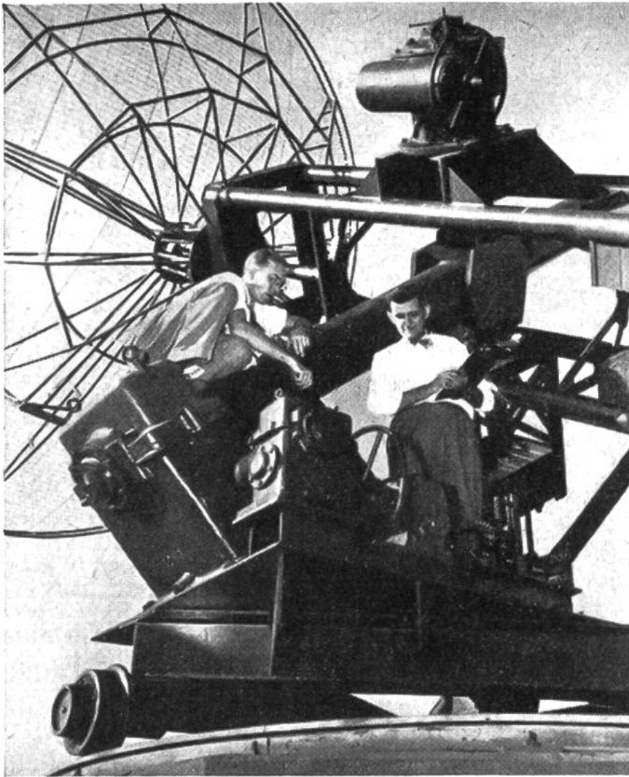
Das Radioteleskop der Cornell-Universität in Amerika. Die Empfangsantenne liegt im Brennpunkt eines parabolischen Hohlspiegels aus Drahtgeflecht, der die von der Sonne stammenden elektrischen Wellen konzentriert. Der Empfang wird sowohl akustisch kontrolliert als auch photographisch aufgezeichnet.

nes parabolischen Hohlspiegels aus Drahtgeflecht, der die von der Sonne stammenden elektrischen Wellen konzentriert. Der Empfang wird sowohl akustisch kontrolliert als auch photographisch aufgezeichnet.