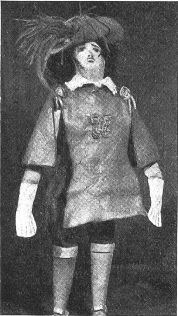
Das ist der Held des Stückes!

Ein besonderer Reiz liegt darin, die Puppen herzustellen. Sie werden aus Holz geschnitzt und dann bekleidet, haben bewegliche Glieder und meist einen ausgesprochenen Charakterkopf. Da der Gesichtsausdruck, im Gegensatz zum alltäglichen Leben, nie wechselt, wirkt die Darstellung allein durch die Bewegung der Glieder um so rührender und stärker.