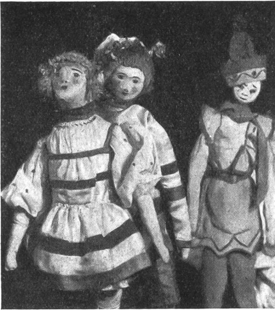
E i n A u s - s c h n i t t a u s d e m v o r a n s t e h e n d e n Z i r k u s b i l d a l s B e i s p i e l v o n G r u p p e n m i m i k .

hinab, rückt er sie über die ganze Breite der Bühne. Von oben schaut er auf die spielenden Puppen hinunter und muss sich ganz in das Wesen und den Charakter jeder seiner Figuren hineinleben, um ihr ein möglichst getreues Eigenleben und den vom Schriftsteller geforderten Typus einzuverleiben. Die charakteristischen Bewegungen werden auf ihre ursprüngliche und einfachste Form gebracht, und gerade diese nicht misszuverstehende Vermittlung eines Gedankens durch Bewegung ist das, was uns beim Marionettenspiel so sehr in Bann hält. Um dem Gedanken aber noch klareren Ausdruck zu geben, muss die Figur auch sprechen; dies zu tun, ist eine weitere Aufgabe der Marionettenspieler. Meist übernehmen die einen das Führen der Puppen, die anderen das Sprechen für dieselben. Immer wird sich die Stückwahl nach der Anzahl und der Geschicklichkeit der Aufführenden zu richten haben.