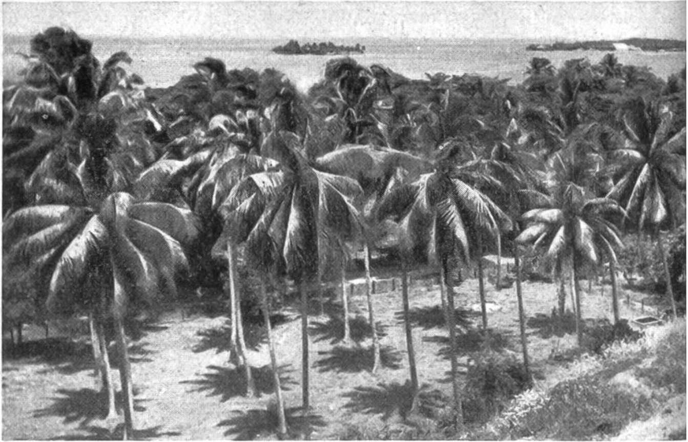
Die Sonne steht im Zenith und der Schatten senkrecht unter den Palmkronen: Mittagsstunde in Polynesien!