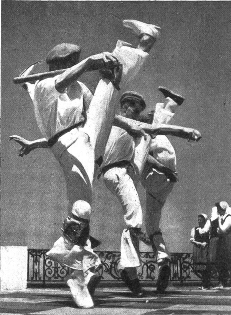
Diese wilde Verzückung heisst „Makil“ und ist nur d. Männern vorbehalten.

und Sinn heute längst nicht mehr vom Volk verstanden wird, lebt auch in den Tänzen der Basken an den Festen des Jahres wieder hell auf. Was einst ein religiöser Vorgang, Tanz zur Austreibung von Dämonen, zur Verehrung der Gottheiten und der Ahnenseelen war, das hat im Lauf der Jahrtausende den religiösen Sinn verloren und sich zum weltlichen Tanz bei Fest und Feier gewandelt. So bewundern wir bei den alljährlichen Festen der Basken Bogen-, Bänder- und Schwerttänze, die in ihren wilden Sprüngen, eindrucksvollen Figuren und Verzückungen noch vieles vom religiösen Ernst ihrer frühzeitlichen Übung bewahrt haben. Gewisse Tänze sind wie bei den Primitiven nur den Männern vorbehalten. Beim „Zamalzin“, einem alten Zauber- und Dämonentanz, wird der Böse Geist