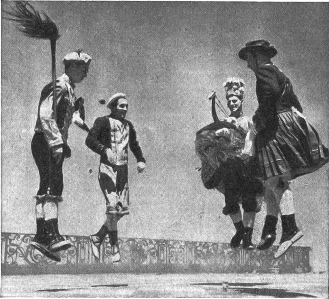
Der „Zamalzin“, ein Dämonentanz der Basken. Zu diesem Tanz gehören der Böse Geist, der Verhexte, der Reitersmann und die Marketenderin.