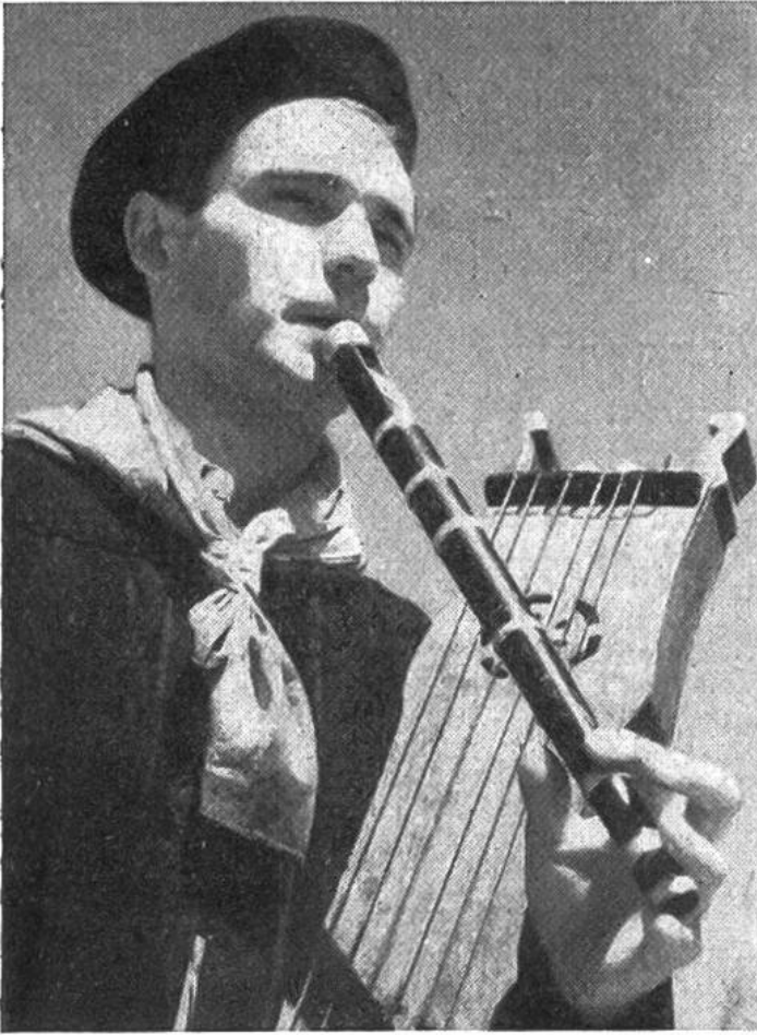
Zum Tanz spielen die Basken mit Blas- und Saiteninstrumenten auf. Der Musikant bedient beide zur gleichen Zeit.

tenen Rest der vorlateinischen Sprachenwelt Latein-Europas dar, die im übrigen völlig untergegangen ist.