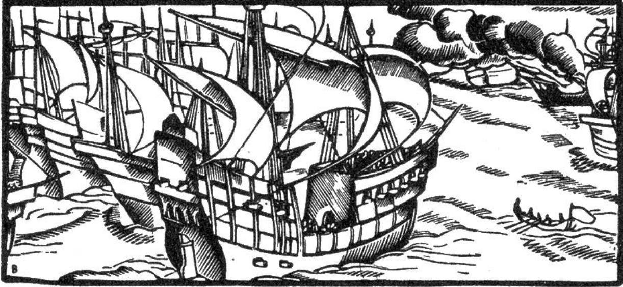
Die Engländer besiegen die mächtige spanische Flotte Armada, 1588.