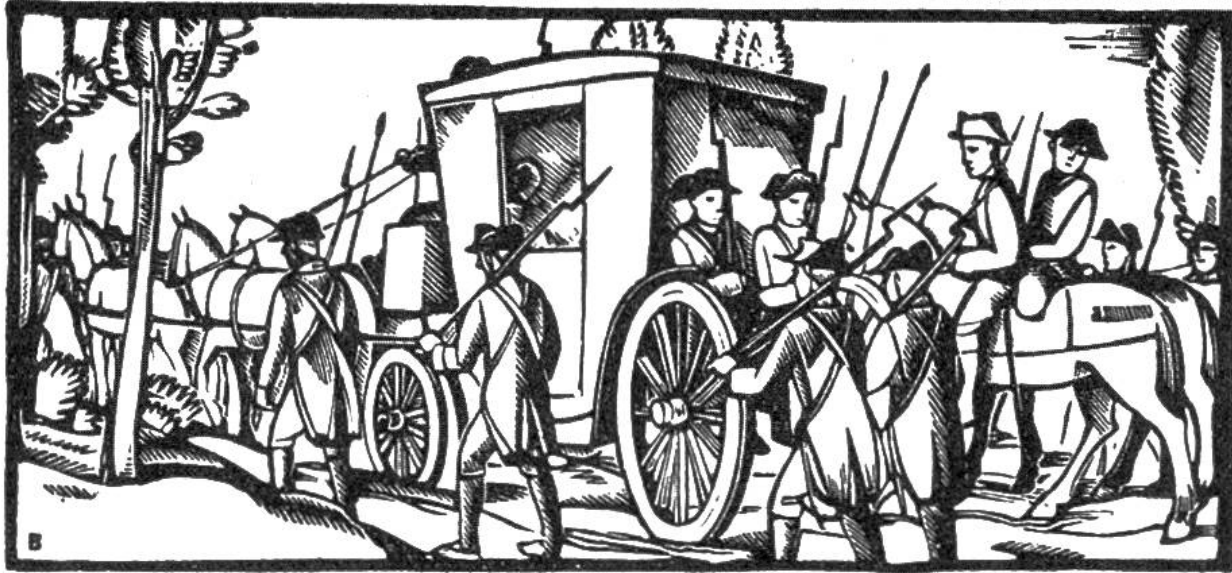
Ludwig XVI. wurde auf der Flucht in Varennes gefangengenommen und mit seiner Familie nach Paris zurückgeführt (1792).