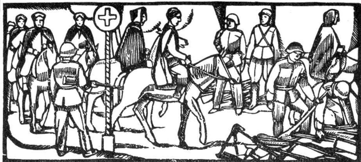
Im Juni 1940 überschreiten nahezu 40000 alliierte Truppen die Schweizer Grenze. Waffenabgabe der Spahis im Berner Jura.