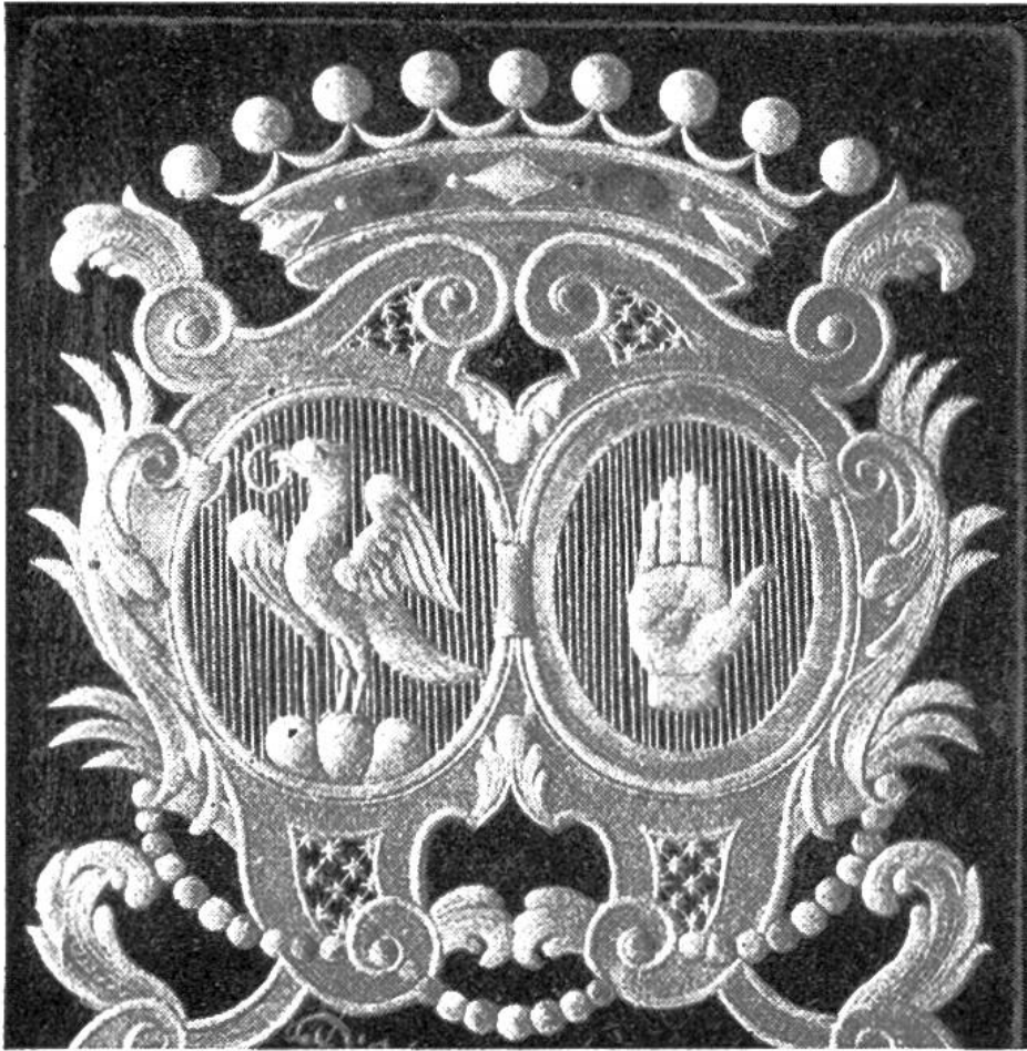
Ausschnitt einer Wappenscheibe, die 1756 ein Berner Pfarrer seiner Gemeinde als Andenken schenkte.