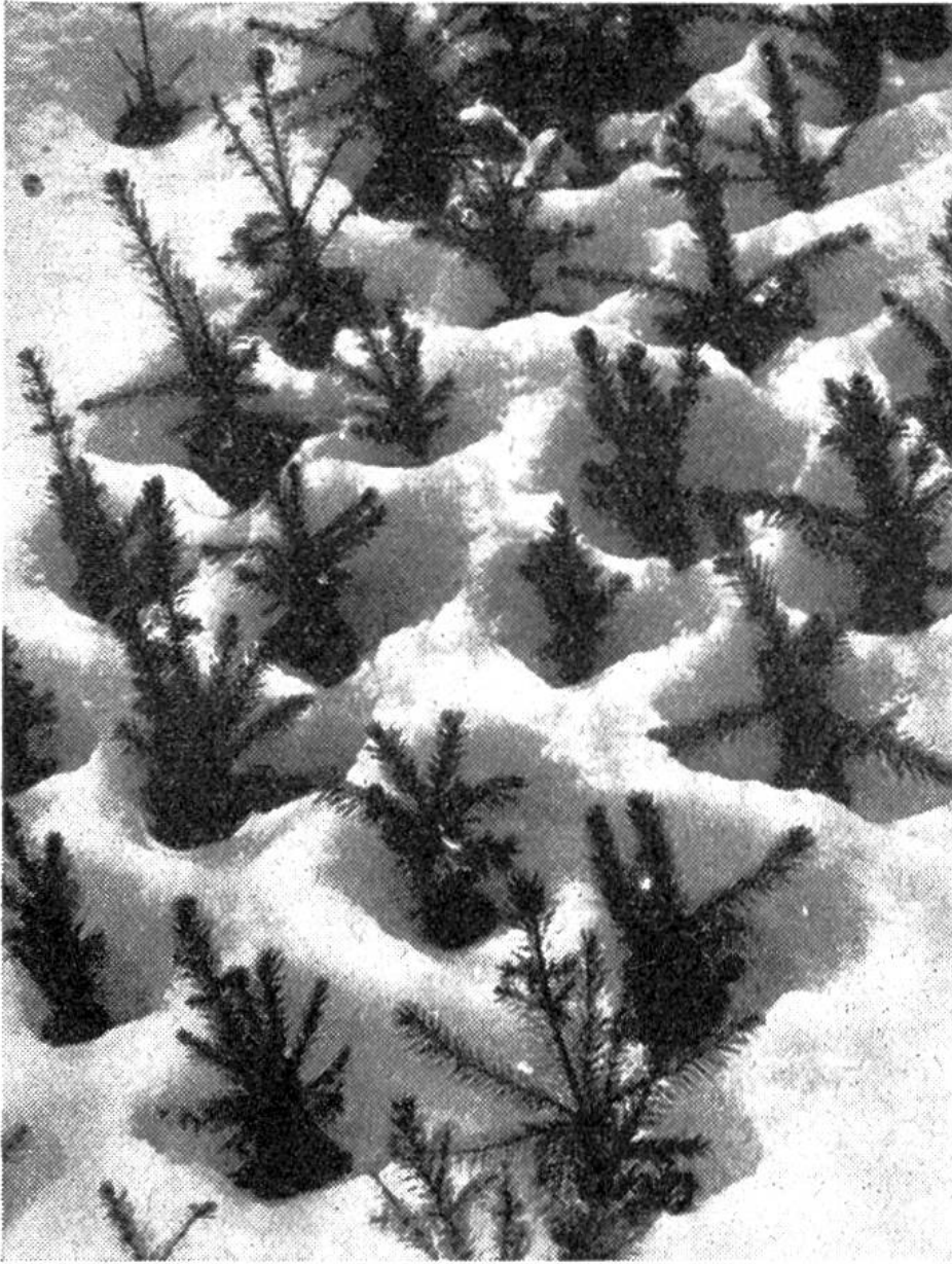
Eine eingeschneite Baumschule.

von kleinsten Kristallen aus Eis übersät er den Halm, er heftet sie an Stamm und Ast und läßt uns die schönen Formen der Natur in ausgeprägterer Form erkennen. Ein Glitzern und Flimmern über allen Wipfeln, eine gläserne, zerbrechliche Schönheit, in der sich die Strahlen der Wintersonne funkelnd brechen. Ganz besondere Blumen – Eisblumen – malt der Winter an die Scheiben, und kleine Rosen aus Kristall setzt er auf die dunkeln, zugefrorenen Seen.