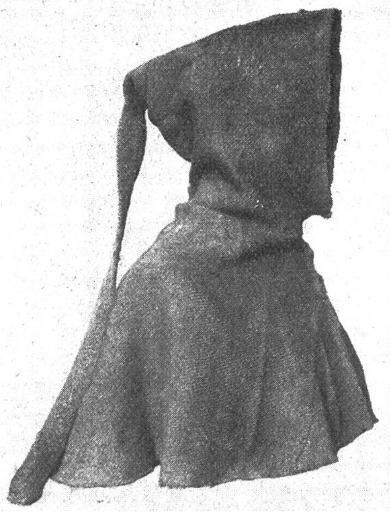
Gewobene Männerkapuze aus einem Grab des Normannenfriedhofs von Herjúlfsnes in Südwestgrönland.

schen mit ihrem Hab und Gut und ihrem Vieh befanden. Die Besiedelung der neuen Kolonie scheint nach aristokratischen Grundsätzen vor sich gegangen zu sein, indem die einflussreichen Männer die günstigsten Fjorde unter sich aufteilten und den übrigen Einwanderern Erlaubnis gaben, sich in ihrem Gebiet anzusiedeln. Insgesamt wurden von den Normannen in Südwestgrönland mindestens 280 Bauernhöfe errichtet, die sich zur Hauptsache