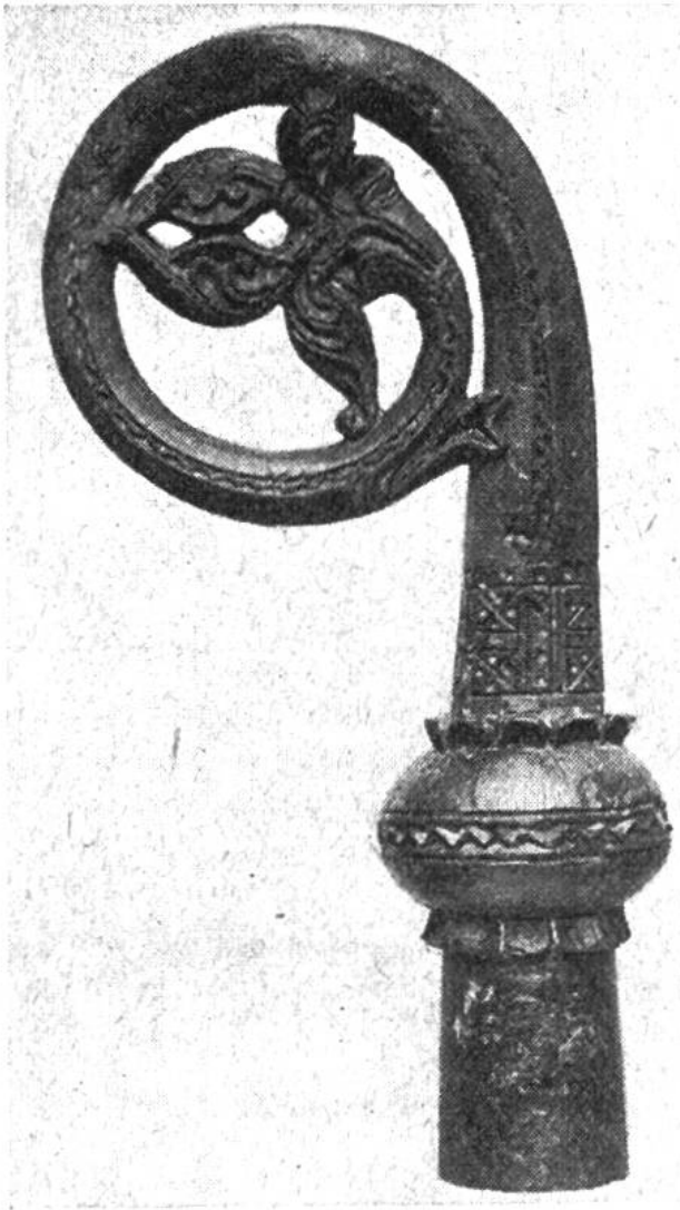
Reich geschnitzter Bischofsstab aus Walrosselfenbein von Gardar, dem Sitz der normannischen Bischöfe auf Grönland.

tauscht wurden. Immerhin waren die Kolonisten bemüht, möglichst weitgehend selbst für die Deckung ihrer Bedürfnisse aufzukommen: sie verstanden es, Sumpferz zu gewinnen und zu verarbeiten, aus Schafwolle Stoffe für Kleider zu weben und aus Speckstein, Treibholz, Walbarten, Elfenbein, Rentiergeweih und Knochen alle möglichen Gegenstände herzustellen. Sie führten auch grosse Entdeckungsreisen durch, die bis nach Nordamerika (Vinland) hinüberführten.