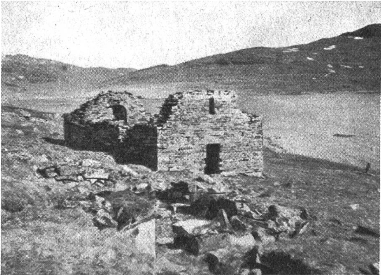
Ruine der normannischen Hvalseyjar-Kirche beim heutigen Qaqortoq.