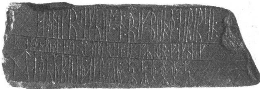
Runenstein, der weit im Norden der Westküste (73. Breitengrad) gefunden worden ist und einen Beweis für die aus-

auf zwei grosse Bezirke verteilten, auf das nördlichere „Vestribygt“ (heute Julianehaab) und das etwas weiter im Süden gelegene „Eystribygt“ (heute Godthaab). Anfänglich war die Kolonie frei und unabhängig. Alljährlich versammelten sich die Bewohner der beiden Siedelungen zu einem „Althing“, wo gemeinsame Fragen behandelt und Rechtshändel abgeklärt