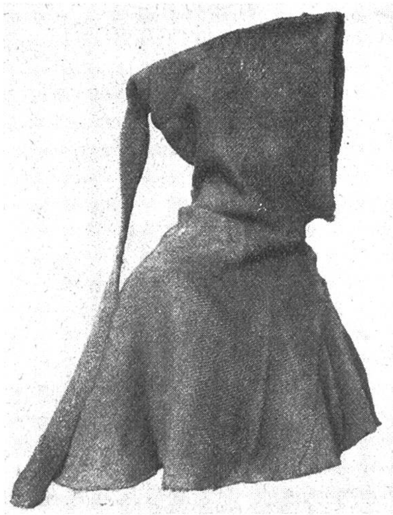
Gewobene Männerkapuze aus einem Grab des Normannenfriedhofs von Herjúlfsnes in Südwestgrönland.

schen mit ihrem Hab und Gut und ihrem Vieh befanden. Die Besiedelung der neuen Kolonie scheint nach aristokratischen Grundsätzen vor sich gegangen zu sein, indem die einflussreichen Männer die günstigsten Fjorde unter sich aufteilten und den übrigen Einwanderern Erlaubnis gaben, sich in ihrem Gebiet anzusiedeln. Insgesamt wurden von den Normannen in Südwestgrönland mindestens 280 Bauernhöfe errichtet, die sich zur Hauptsache