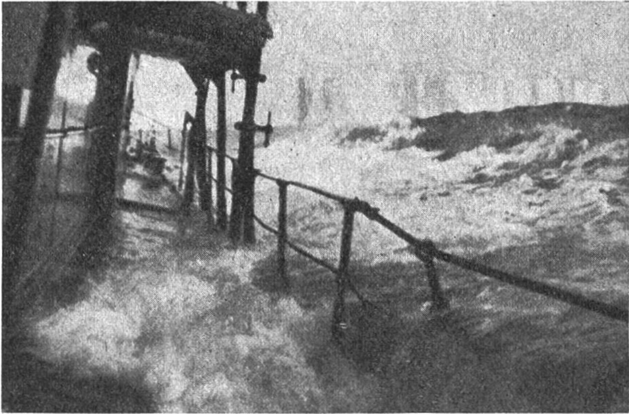
Zwei Gefahren: im Vordergrund das stürmische Meer, im Hintergrund der drohende Eisberg.

Luftwirbel befindet, welcher die gewaltigsten Wassermengen bis in Wolkenhöhe reisst.