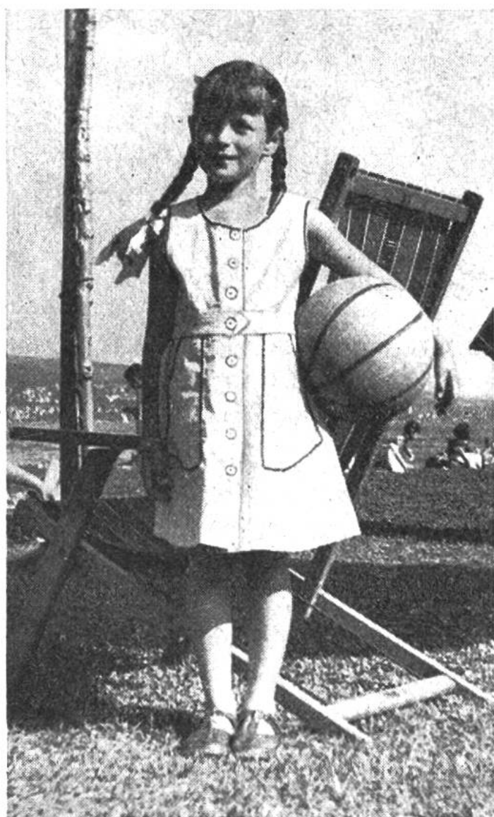
Das Trägerkleid lässt sich an warmen Tagen gut ohne Blüschen tragen.

Dieses Jahr bringen wir wieder nützliche Sachen, praktisch für euch und eure Geschwister und als Geschenke. Sicher werden alle von euch mit Freuden arbeiten und sich interessieren, wie ein Stück nach dem andern entsteht. – Wir wünschen gutes Gelingen zu der unterhaltenden und nützlichen Beschäftigung.