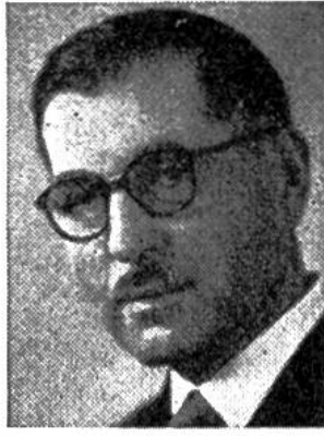
Dr. Karl Kobelt von Marbach (St. G.) * 1891 seit 1941 i. Amte Militärdepartem.