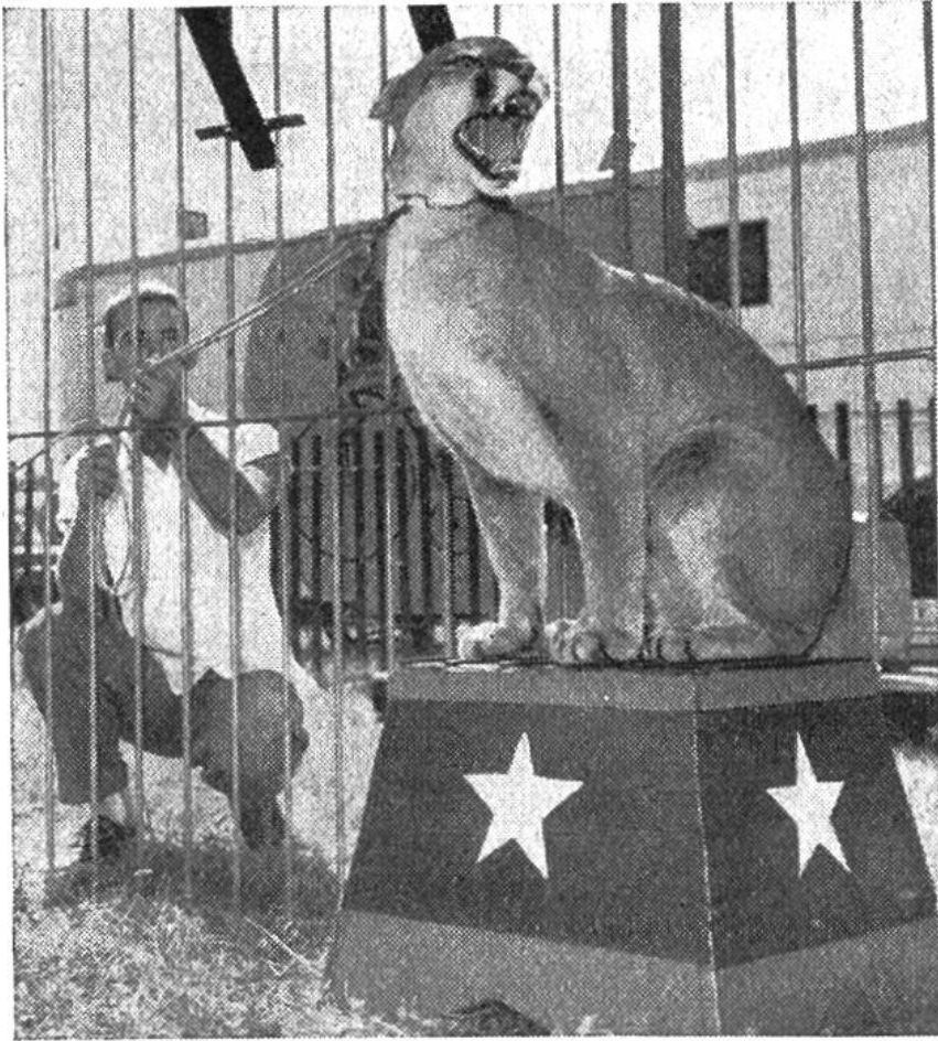
Bis sich der Puma an den Dompteur gewöhnt hat, wird er von aussen am Halsband festgehalten.