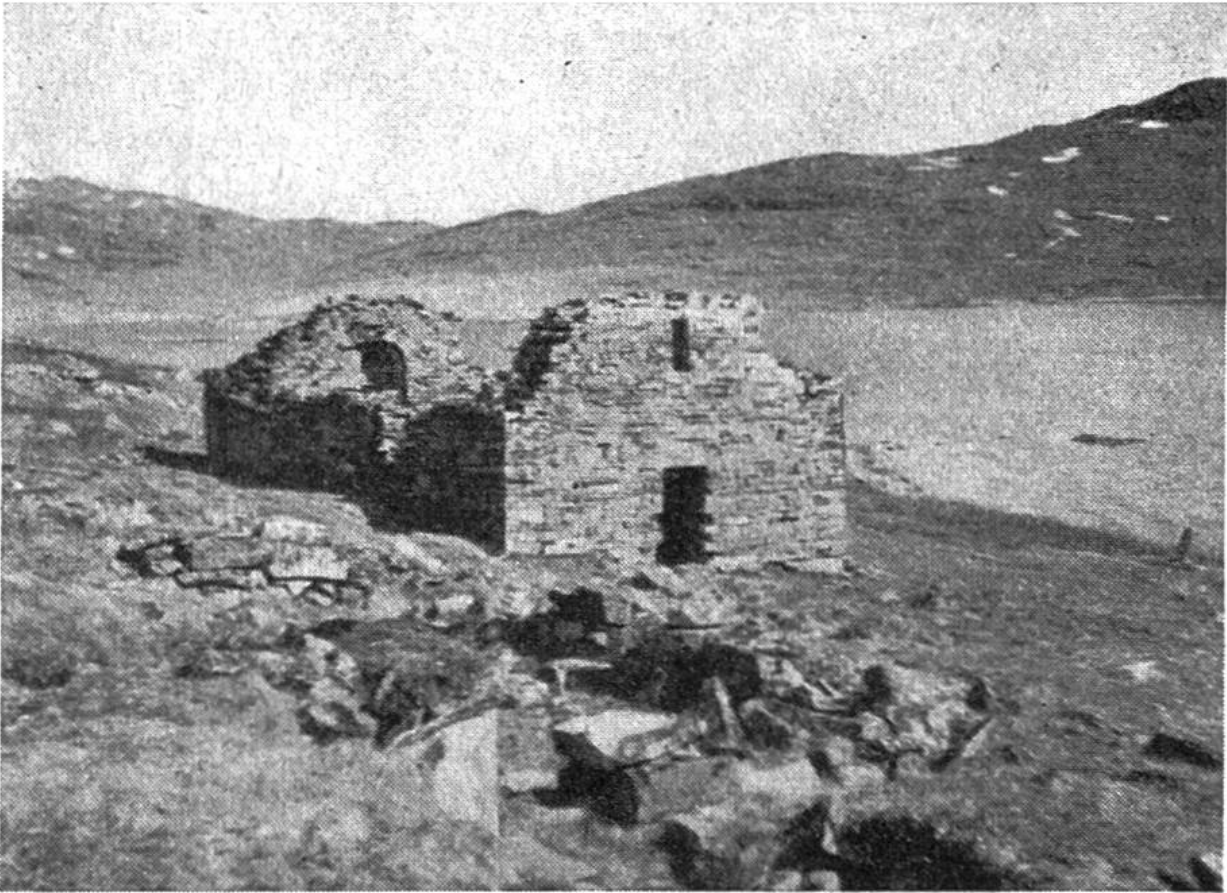
Ruine der normannischen Hvalseyjar-Kirche beim heutigen Qaqortoq.