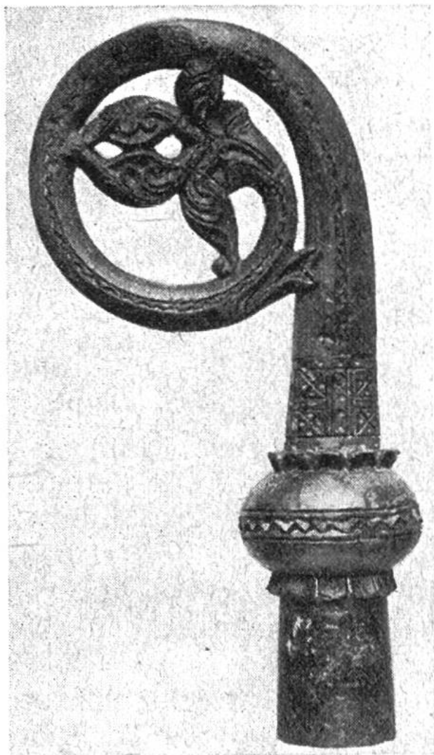
Reich geschnitzter Bischofsstab aus Walrosselfenbein von Gardar, dem Sitz der normannischen Bischöfe auf Grönland.

tauscht wurden. Immerhin waren die Kolonisten bemüht, möglichst weitgehend selbst für die Deckung ihrer Bedürfnisse aufzukommen: sie verstanden es, Sumpferz zu gewinnen und zu verarbeiten, aus Schafwolle Stoffe für Kleider zu weben und aus Speckstein, Treibholz, Walbarten, Elfenbein, Rentiergeweih und Knochen alle möglichen Gegenstände herzustellen. Sie führten auch grosse Entdeckungsreisen durch, die bis nach Nordamerika (Vinland) hinüberführten.