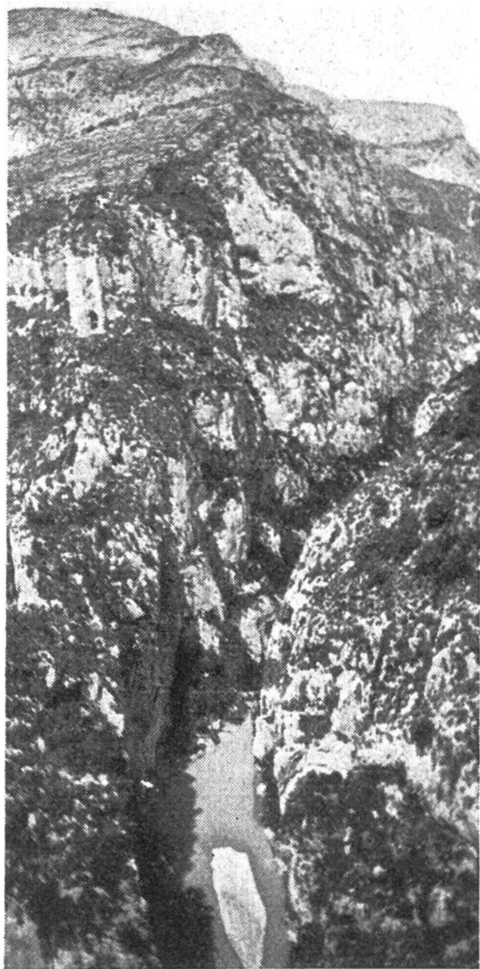
Das europäische Gegenstück zum Grand Canyon in Amerika: die Gorges du Verdon in Südfrankreich.

gen, die Ungewissheit, ob es sich von einem Punkt bis zum andern um 500 m oder um 5 km handelt, diese Unfähigkeit ist auch jenen Menschen zum Verhängnis geworden, welche sich als Pioniere in die unheimlichen Tiefen gewagt haben. Wie in den Höhen der Alpen und des Himalaya zahlreiche wagemutige Expeditionen den Tücken des unerforschten Raumes zum Opfer gefallen sind, so sind in den zerklüfteten Abgründen des Grand Canyon schon viele Forscher verschollen. Hunderttausende von Touristen sehen sich alljährlich diese bezaubernden Tiefen an; doch die wenigsten wissen, dass es auch in Europa – allerdings in weit bescheideneren Ausmassen – eine Art Canyon gibt, eine tief in die