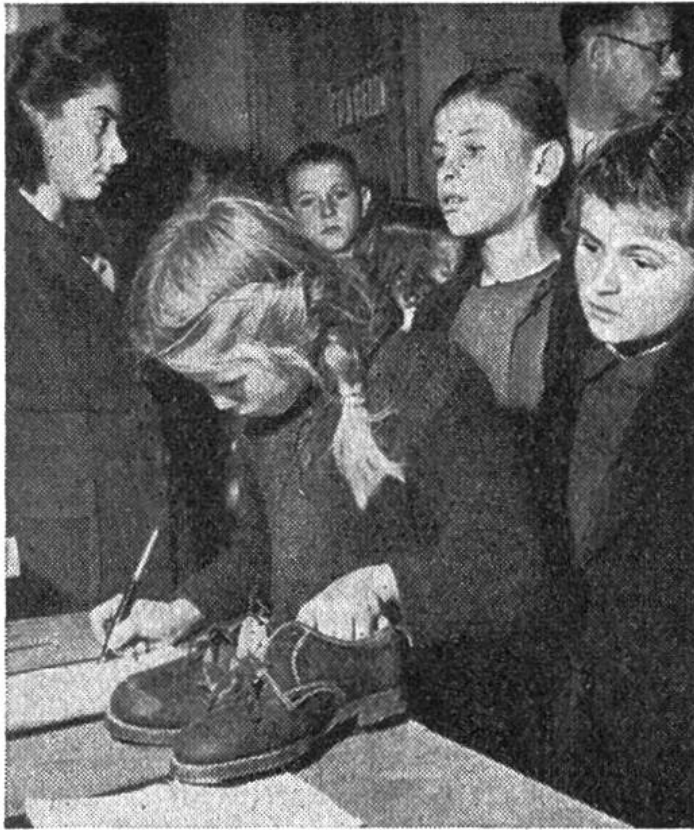
Den Empfang von einem Paar Schuhe zu bescheinigen, ist für die kleine Griechin ein grosses Ereignis.

zu leiden haben. Ansteckende Krankheiten, Malaria, Tuberkulose müssen bekämpft werden, und viel Geld wird für Anschaffungen von medizinischen Instrumenten, Röntgenapparaten, Thermometern, Ambulanzen und anderen Gerätschaften ausgegeben. Diese Beträge stehen nicht weit hinter den für Nahrungsmittel aufgewendeten zurück. Auch gibt es Bekleidungs- und Unterkunftssorgen. Ihnen versucht man durch Verteilen von Kleidern