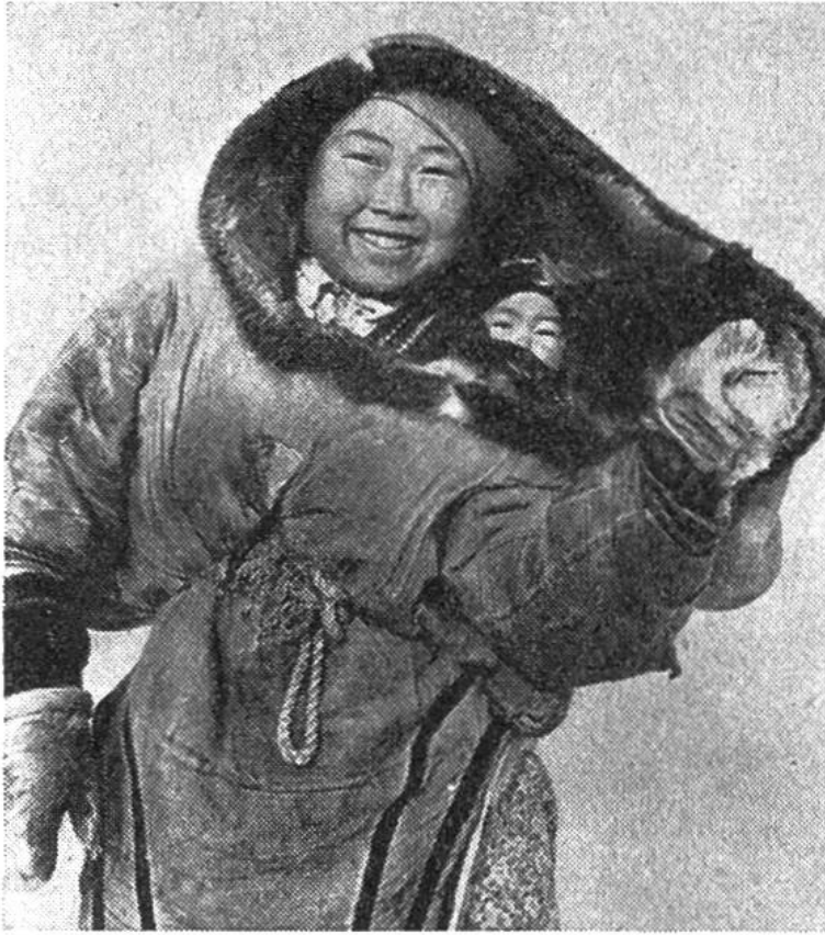
Junge Eskimo-Mutter mit ihrem Kind.

in rohem und gefrorenem, nur gelegentlich in angekochtem Zustand verzehrt. Anders verhält es sich in den Übergangszeiten und im Sommer: da unterhalten die kanadischen Eskimos kleine Feuer aus mühsam zusammengesuchtem Heidekraut und Reisig. Zu dieser Zeit leben sie in Zelten, die ursprünglich stets aus Rentierfellen bestanden, während heute auch solche aus Stoff verwendet werden.