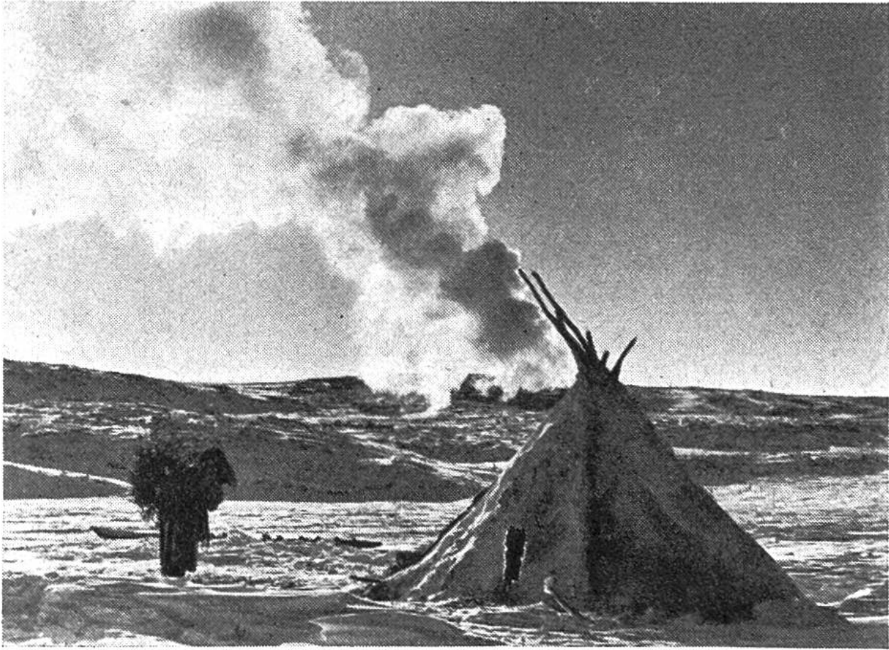
Zelt aus einem Stangengerüst und darübergerlegten Rentierfellen. Davor eine Frau, die mit einem Bündel Reisig und Heidekraut zum Feuern zurückkehrt.