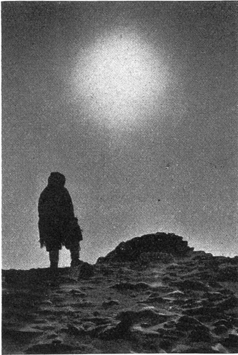
Eskimo vor einem einsamen Grab – einem Steinhaufen in der Tundra.

Tätigkeit der Königlich Kanadischen Polizei zu sein; denn die Rechtsvorstellungen der Eskimos sind anders als die kanadisch-europäischen, so dass die Eingeborenen manchmal für Handlungen bestraft werden, die sie nicht als Verbrechen ansehen. Dagegen sind die Bemühungen der Regierung im Gesundheitsdienst, zu welchem auch Flugzeuge eingesetzt werden, eine wahre Wohltat. Es ist zu hoffen, dass das kleine Volk der kanadischen Eskimos, das sein entbehnungsrei-