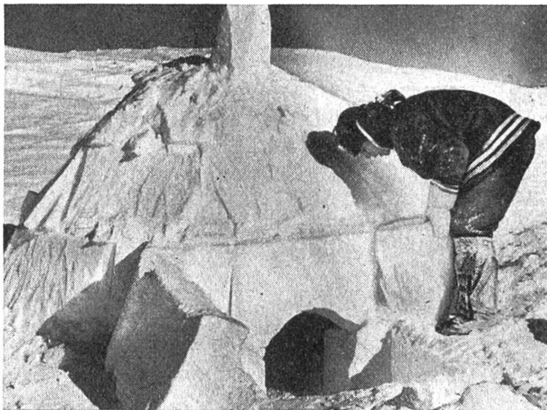
Das aus Schneeböcken errichtete Iglu stellt die Winterwohnung der kanadischen Eskimos dar.

rakteristische Lebensweise an der Meeresküste als Jäger der grossen Seesäugetiere Seehund, Walross und Wal nicht oder nur in sehr geringem Masse kennen: bis vor nicht allzu langer Zeit lebten sie ausschliesslich als Rentierjäger im Inland; erst spät stiessen Teile der Bevölkerung zur Küste vor.