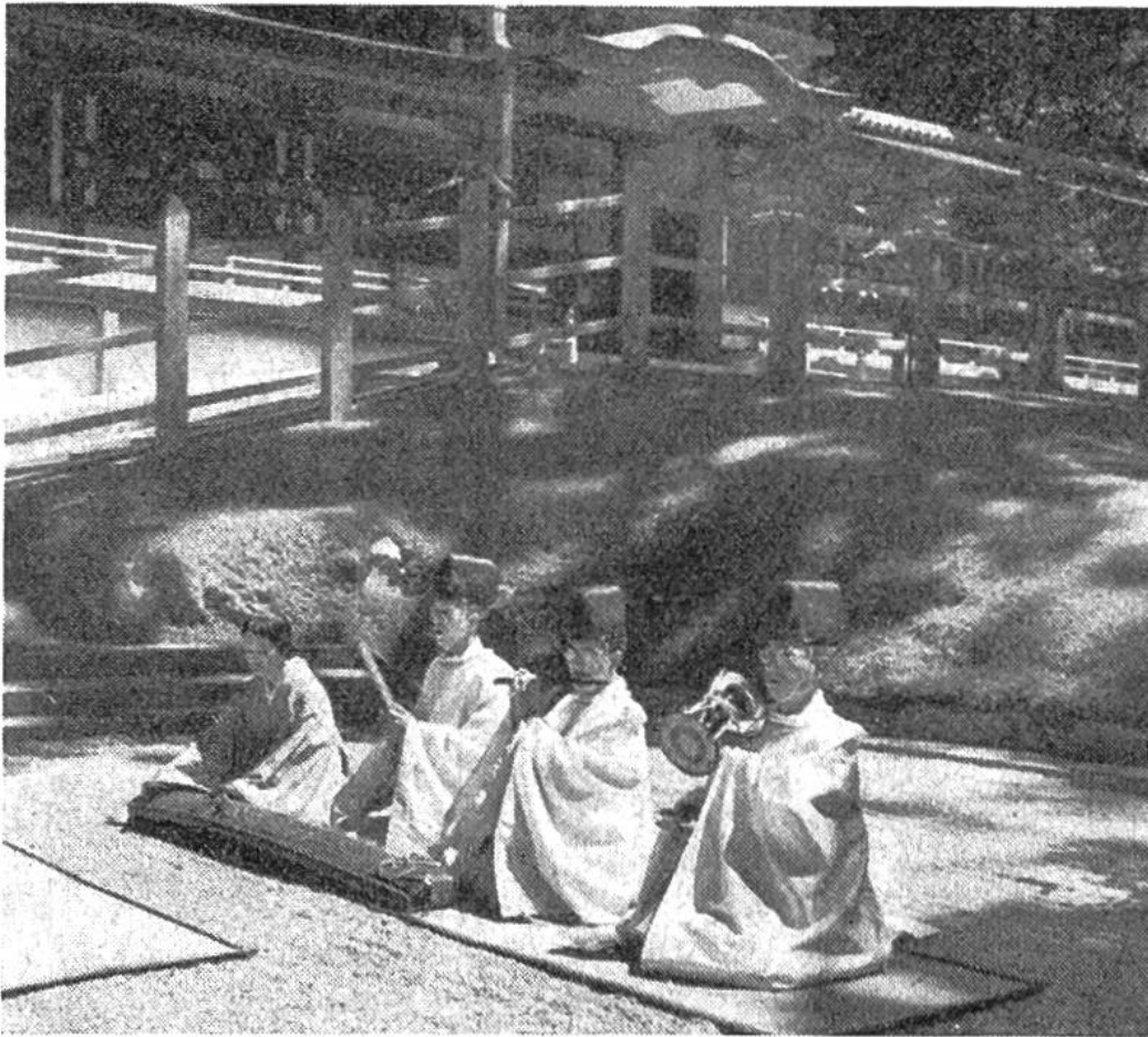
Musik auf den schrill tönenden japanischen Instrumenten leitet ein grosses Shinto-Fest ein.

mus eine Verschmelzung eingegangen ist. Sehr oft werden an der gleichen Tempelstätte die Kulthandlungen beider Religionen durchgeführt.