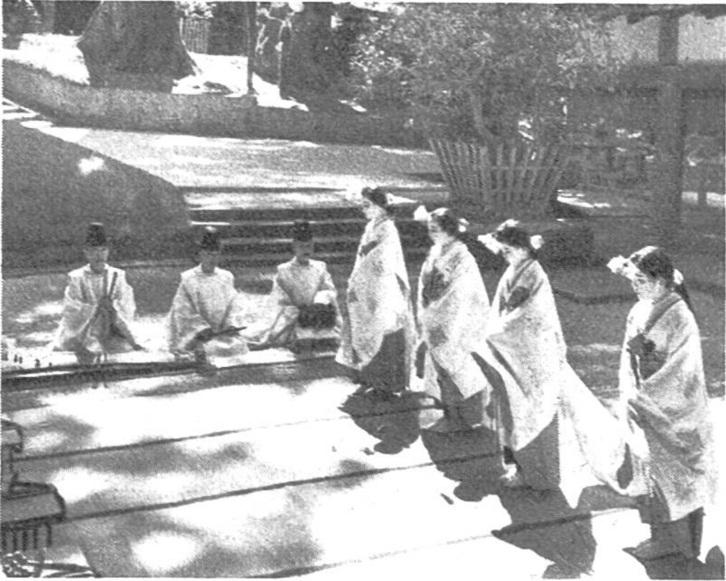
Am Shinto-Fest tanzen Tempelmädchen zur Musik der Priester im Tempelgarten.

Feste vor den heiligen Torbögen und Tempeln, die als „Schreine“ der Gottheiten betrachtet werden, sind reich an Besuch, Farbe und Klang.