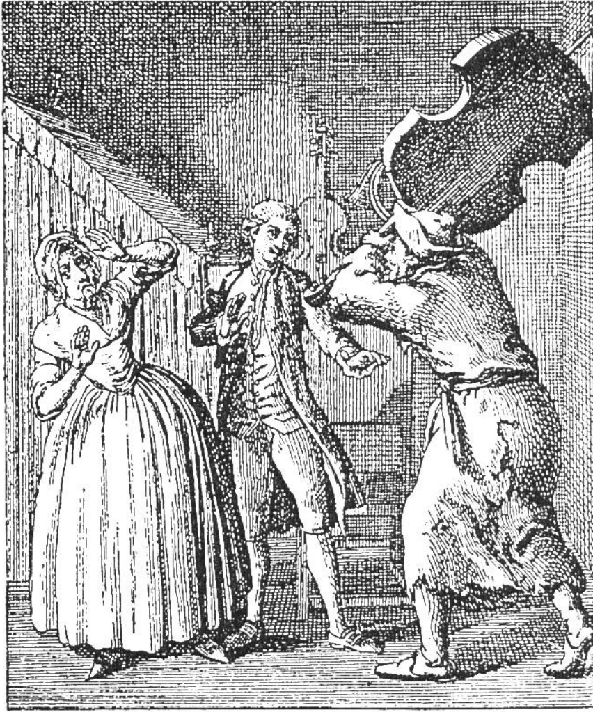
«Willst du dein Maul halten? Willst das Violoncello am Hirnkasten wissen?» Sekretär Wurm, Miller und seine Frau. Kupferstich von Chodowiecki zu «Kabale und Liebe».

Es schlossen sich ihr, die vom schlichten Reichtum des Herzens gab, die Männer aus hochadligem Geblüt an, um dem Dichter mit ehrenden Gaben beizustehen. Und es kam schliesslich derjenige dazu, dessen Freundschaft alles galt: Johann Wolfgang Goethe, der Dichterkönig. Jetzt, in dessen Gesellschaft zu Weimar, fühlte sich Schiller wirklich reich, weil er einen Gleichgesinnten mit gleichem schöpferischem Streben gefunden: «Gib der Welt, auf die du wirkst, die Richtung des Guten!»