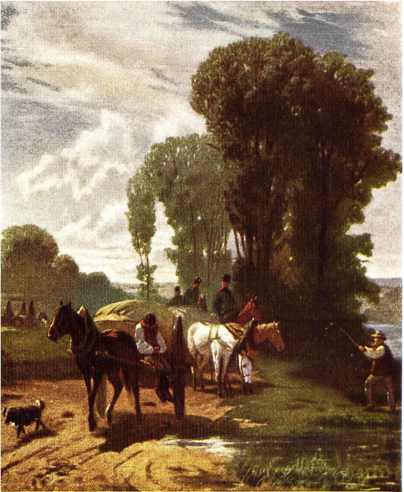
HALT AN DER TRÄNKE, von Hans von Marées, München, 1837-1887.