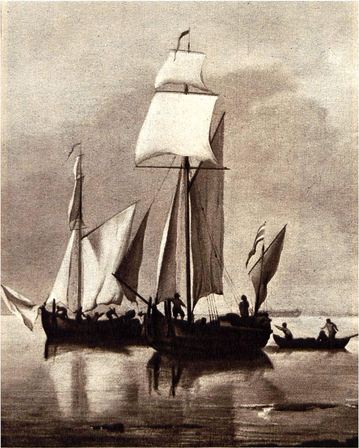
Schiffe im Hafen, von Willem van de Velde d. Jg., Amsterdam, 1633 - 1707. (Galerie Thyssen, Lugano.)