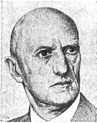
Dr. Philipp Etter von Menzingen (Zug) * 1891, seit 1934 im Amte