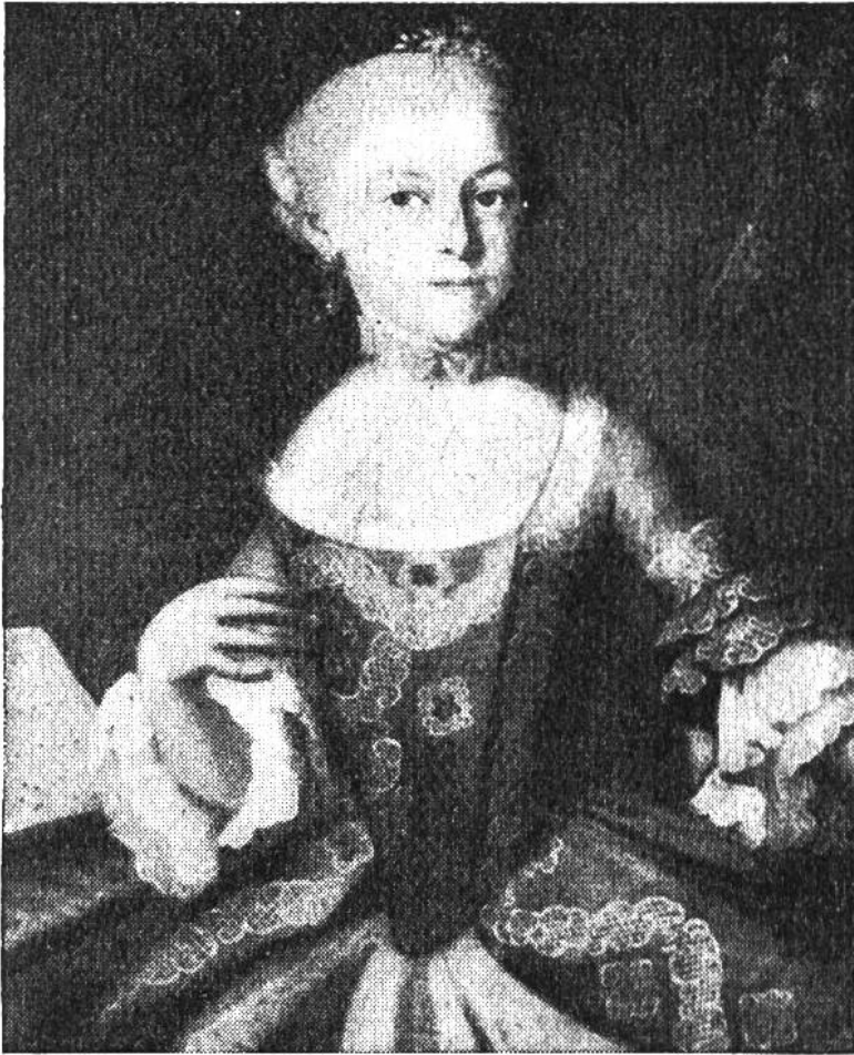
Das Nannerl, Mozarts Schwester, in der Staatsrobe. Ölgemälde im Mozart-Museum in Salzburg.

Was? sagt der Vater. Solch närrische Bitte! Der Kleine hat ja noch nicht den geringsten Unterricht im Geigenspiel erhalten; wie sollte er da gleich ein Streichtrio mitspielen können! Der kleine Musikant aber meint ganz ruhig: Um nur die zweite Geige zu spielen, braucht man's doch nicht erst gelernt zu haben! Papa Mozart aber bleibt beim «Nein»! Ja, er schickt den Störenfried gleich weg. Schachtner jedoch, der die zweite Violine spielt, bittet für den Kleinen, und Papa sagt zu Wolfgang: «Geig mit Herrn Schachtner, aber so stille, dass man dich nicht hört, sonst musst du fort.» Und Wolfgang geigt mit Schachtner die zweite Geige.