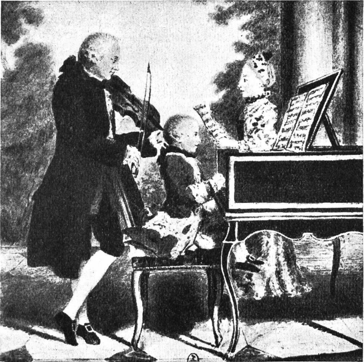
Mozart im Alter von 7 Jahren mit Vater und Schwester in Paris. Stich von Delafosse um 1764.

von Nassau-Weilburg, welche die Mozarts nun nach Holland, in den Haag, einlädt. Schliesslich aber kehren sie nach dreijähriger Abwesenheit über Paris, Südfrankreich, die Schweiz und München nach Salzburg zurück.