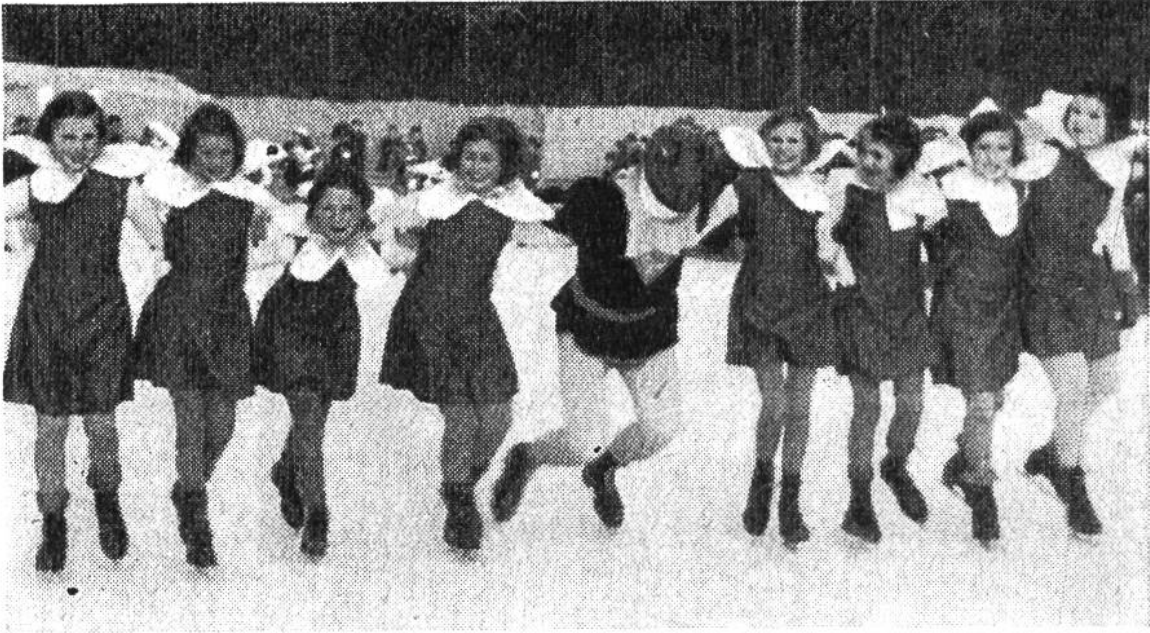
Der Froschkönig tritt mit den Blumenkindern auf.

auf, vielleicht in Begleitung von ein paar Blumenkindern, und alle fahren in einfachem Tanz zum Brunnen hin. Das ist noch Eislauf ohne Darstellungskunst; jetzt aber wird alles verzaubert, der Frosch verschwindet im Brunnen, die Blumenkinder schlafen auf dem Brunnenrand ein, und weit hinten tritt die Prinzessin auf. Irgendwoher fällt ihr ein goldener oder bunter Ball zu, sie fängt ihn auf, beginnt zu tanzen und spielt mit ihm, bis sie ihn schliesslich im Brunnen verliert. Der Frosch findet ihn, taucht auf und verlangt durch Zeichen einen Kuss von der Prinzessin; mit einem solchen soll sie den Ball wieder