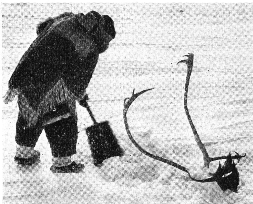
Ein unterwegs erlegtes Rentier wird eingegraben und die betreffende Stelle mit dem Geweih markiert, damit der Eskimo auf der Rückfahrt über ein Fleischdepot verfügt.

zubereiten und auf das Küstenleben umzustellen. Einzig in der riesigen Tundrazone westlich der Hudsonbai scheint diese