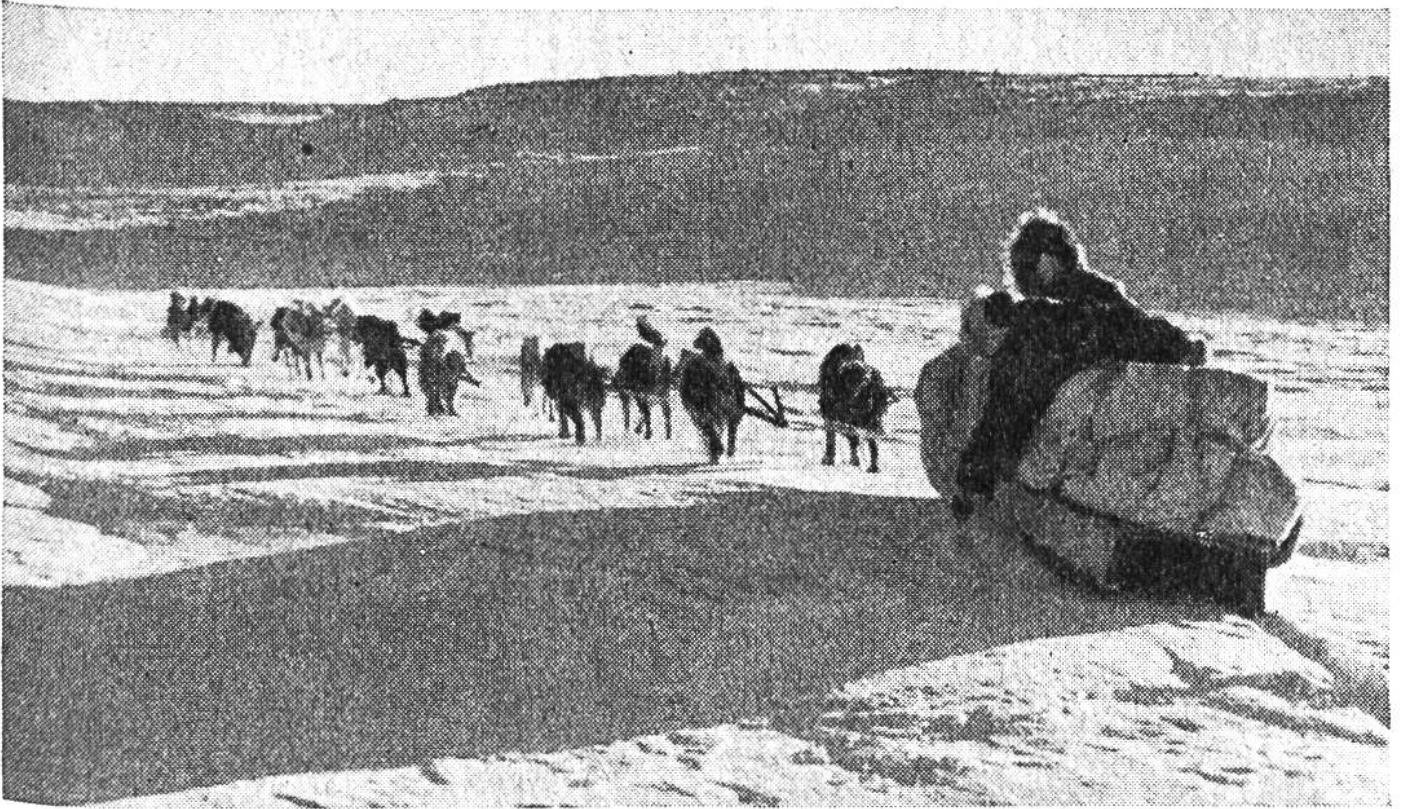
Hundeschlitten auf der Fahrt durch die schneebedeckte Tundra.