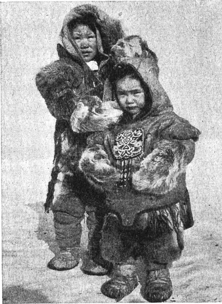
Kinder in warmen Winterkleidern aus Rentierfell mit Glasperlenverzierung.

Zustand genossen, während sie im Sommer über kleinen Reisigfeuern gekocht wird. Die Kleidung wird aus Rentierhäuten hergestellt, die zu diesem Zweck von den Frauen auf der Fleischseite sorgfältig geschabt und von allen Rückständen gereinigt werden. Die Winterkleider sind wärmer und praktischer als bei allen andern arktischen Völkern. Die Karibu-Eskimofrauen verstehen es aber nicht nur, sehr zweckmässige Kleider zu nähen, sondern sie verzieren diese auch aufs schönste. Zum Teil werden hellere Fellpartien eingesetzt, so dass bestimmte Muster entstehen, oder es sind farbige Perlen, die in origineller Weise aufgenäht werden.