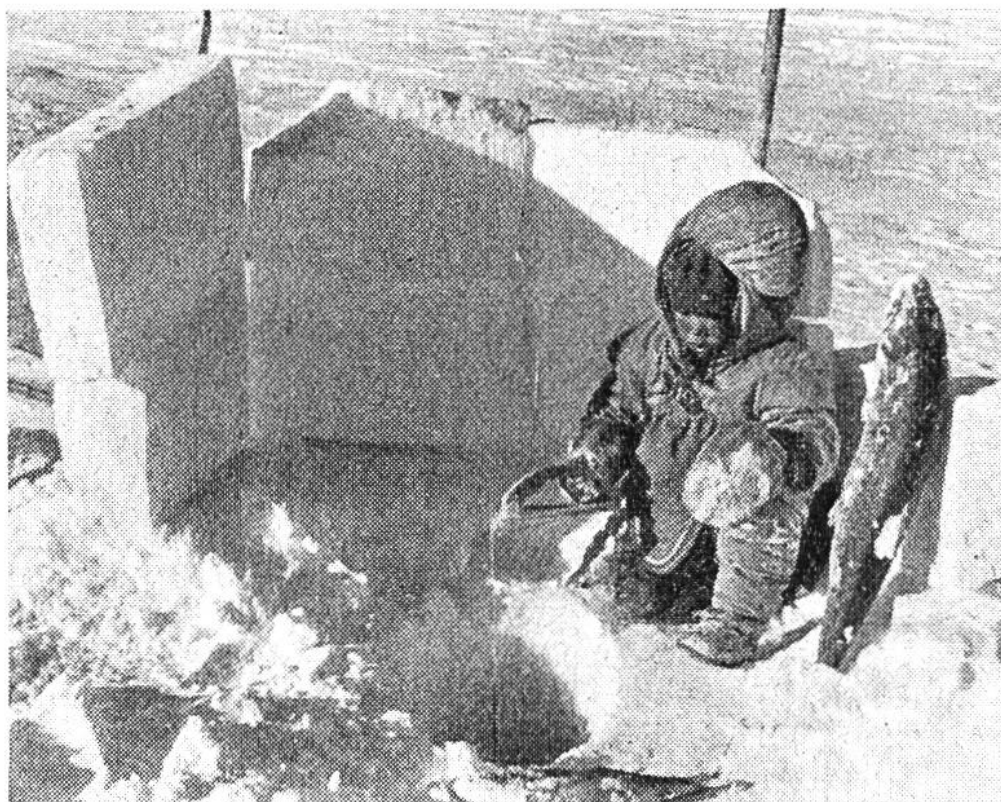
Mädchen beim Fischen durch ein Loch in der nahezu 2 m dicken Eisschicht. Einige Schneeblöcke dienen als Windschutz.

zubereiten und auf das Küstenleben umzustellen. Einzig in der riesigen Tundrazone westlich der Hudsonbai scheint diese