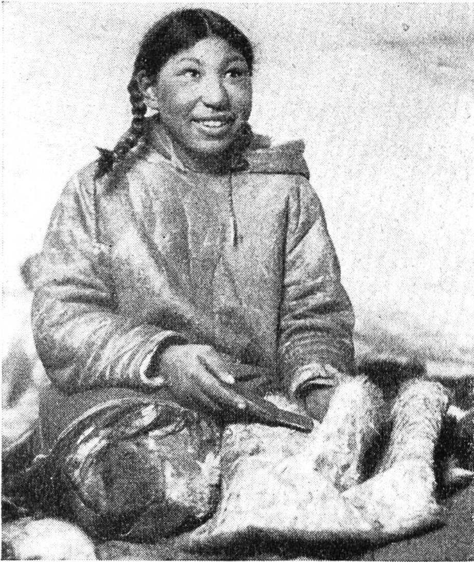
Das Schaben der Innenseite des Fells als Ersatz für das Gerben ist Frauenarbeit

kleine Restgruppe zurückgeblieben zu sein und die alte Lebensweise beibehalten zu haben.